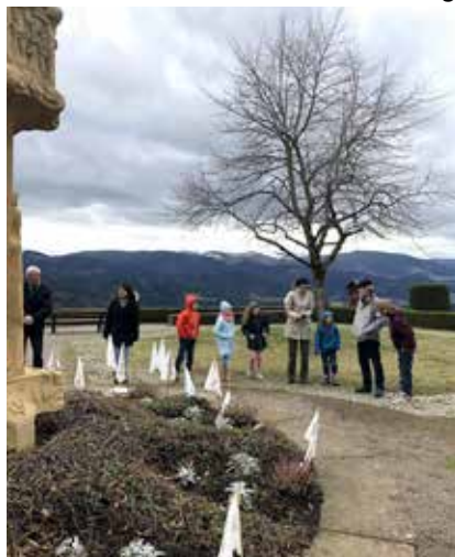
Gemeinsame Spiele nach dem Sonntagsgottesdienst auf dem Platz bei der Wallfahrtskirche