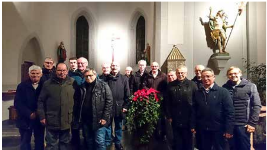
Vertreter der Gebetsgruppen aus dem Renchtal und Schutterwald beim Friedensgebet in Offenburg-Bühl.

Die Mitbeter und Mitbeterinnen aus unserer Gemeinde waren über das