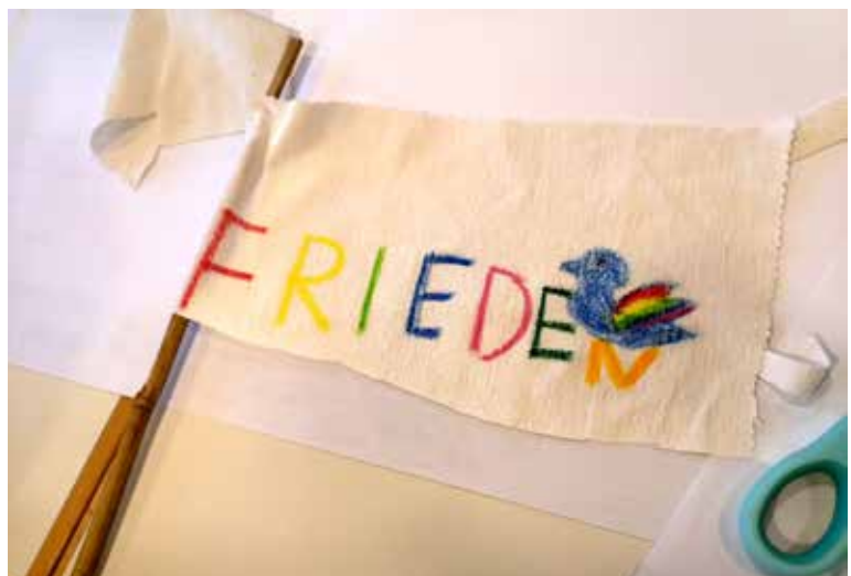
Beim Stationslauf wurden Friedensfahnen gestaltet

In der ersten gemeinsamen Runde ging es um das gegenseitige Kennenlernen und eine Einführung zum inhaltlichen Thema. Das Jahr 2020 steht für die kirchlichen Hilfswerke unter dem Schwerpunkt Frieden. Die Gebetswache der Männer und die spirituellen Angebote des Hauses haben