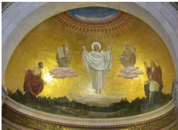
Mosaik „Die Verklärung Jesu“ in der Kirche auf dem Berg Tabor in Israel

Im Vortrag war ein zentrales Wort: Wir Christen brauchen ein hörendes Herz! Wir sollen auf das hören, was uns die Heilige Schrift sagt. Ihm fällt auf, dass auch bei vielen engagierten Christen viel Wissen nicht mehr da ist. Die Kirche wurde von