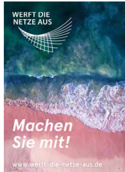
Gebetsaktion – „Werft die Netze aus“

Bereits 2019 haben sich eine Vielzahl von Betern zum ersten 24-Stunden-Gebet anlässlich des Weltgebetstages um geistliche Berufungen beteiligt, um diesem wichtigen Anliegen neue Kraft zu verleihen. An weit mehr als 400 Orten in Deutschland kamen unter dem Leitwort „Werft die Netze aus“ Menschen im Gebet zusammen. Sie folgten damit dem Auftrag Jesu, um Arbeiter in seinem Weinberg zu senden. Damals konnte dieser Gebetsaufruf im größeren Rahmen stattfinden. Doch auch in