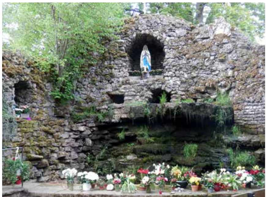
Lourdesgrotte Elsenau, die eine gern besuchte und idyllisch gelegene Wallfahrtsstätte besonders im Marienmonat Mai ist