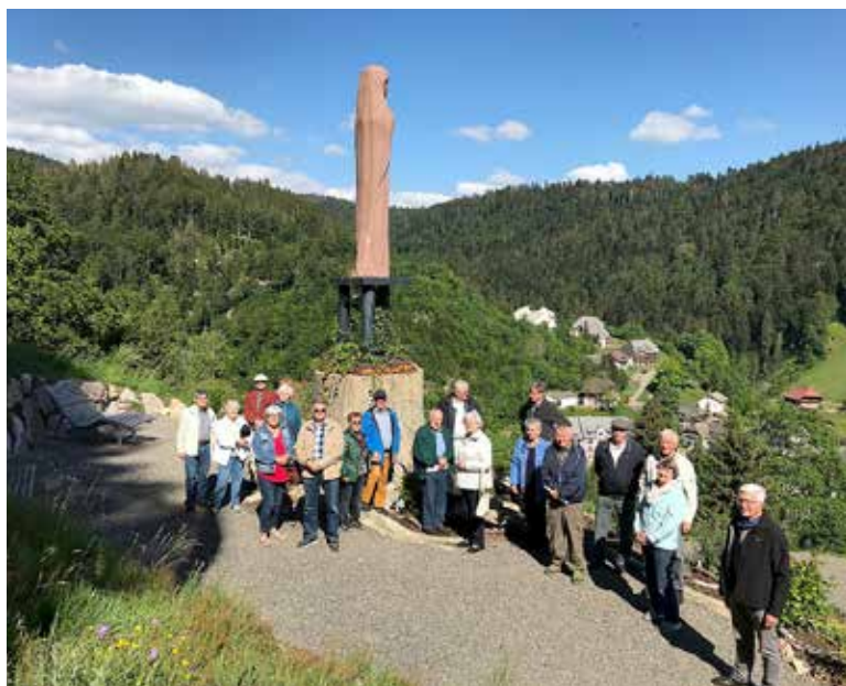
Gruppenfoto der Gebetsgruppe Wutachtal bei der Marienstatue