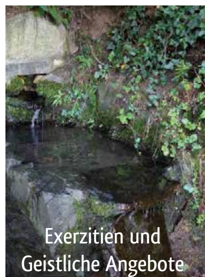
Exerzitien und Geistliche Angebote

Anmeldung. Auch Einzelgästen wird eine Reservierung empfohlen.