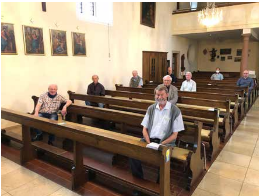
Jeder Gebetsmann hat seinen festen Sitzplatz für die Gebetszeiten und Gottesdienste – die Männer der Gebetswache Hockenheim sitzen an den markierten Plätzen.