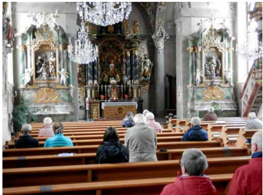
In der Pfarrkirche St. Ulrich in VS-Obereschach hat sich eine Betergemeinde von VS-Obereschach und Gebetsmännern aus dem Dekanat SB zur Anbetungsstunde und Meditation zusammengefunden.

Nachdem die Anbetungswoche der Gebetsmänner auf dem Lindenberg aus dem Dekanat Schwarzwald-Baar wegen der derzeitigen Ausnahmesituation abgesagt werden musste, trafen sich die Männer und Angehörige in dem fraglichen Zeitraum Anfang Juni 2020 zu einem Gebetstreffen und Meditation in der Pfarrkirche St. Ulrich in VS-Obereschach zur Anbetung mit Aussetzung in der Monstranz. Die Gebetsstunde stand unter dem Motto, den Heiligen Geist für die großen Anliegen unserer Zeit um seinen Beistand zu bitten. Entsprechend den geltenden Vorgaben musste sich die Betergemeinde mit 2 Meter Abstand in der Kirche verteilen. Erfreulich ist, dass durch die Initiative von einigen Männern in der Pfarrgemeinde Obereschach seit geraumer Zeit dort wöchentlich eine Anbetungsstunde stattfindet und durch unser Mitbeten konnten wir die Anbetung in Obereschach mit unterstützen.