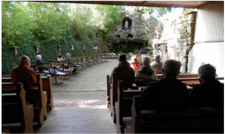
Zum Gebet/Maiandacht kamen die Gebetsmänner aus dem Dekanat SB zum gemeinsamen Gebet in die idyllisch gelegene Wallfahrtsstätte Elsenau bei Niedereschach-Kappel zusammen.

Um die ausgefallenen Gebetswoche auf dem Lindenberg ein Stückweit zu kompensieren, trafen sich die Gebetsmänner aus dem Dekanat Schwarzwald-Baar mit ihren Angehörigen Ende Mai 2020 in der beschaulich gelegenen Lourdesgrotte Elsenau bei Niedereschach-Kappel zum Gebet/Maiandacht. In dieser Wallfahrtsstätte hat das KMW in den vergangenen Jahren jeweils eine Maiandacht mit Marienpredigt und einer großen Teilnehmerzahl durchführen können. Diesmal konnte man sich wegen der vorgegebenen gesetzlichen Beschränkungen nur in einem kleineren Kreis in dieser Wallfahrtsstätte zum Gebet treffen.