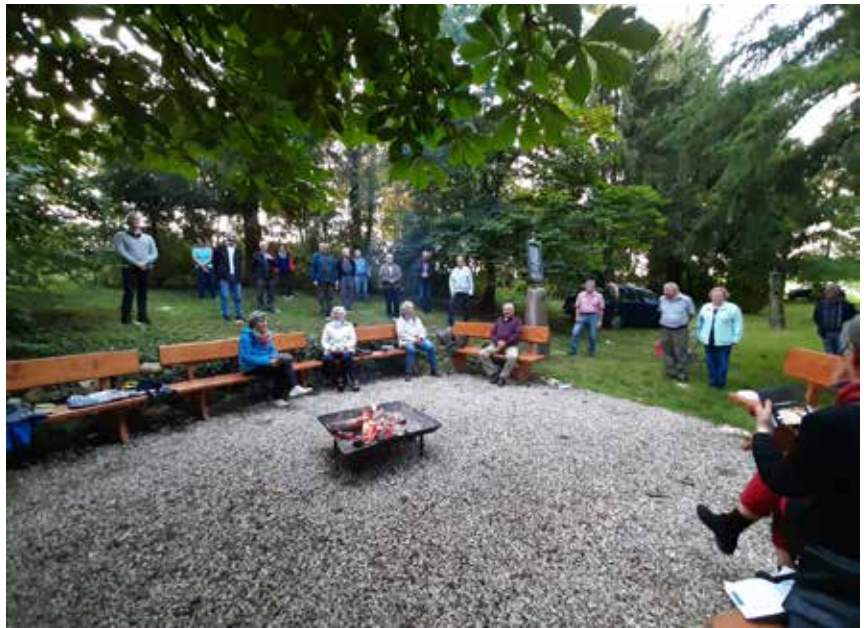
Zum Gottesdienst und Johannisfeuer haben sich die Männer und Frauen beim Chäppeli versammelt.

Das Lob und der Dank für für unsere Schöpfung zog sich gleichsam als Leitfaden durch die gesamte Andacht.