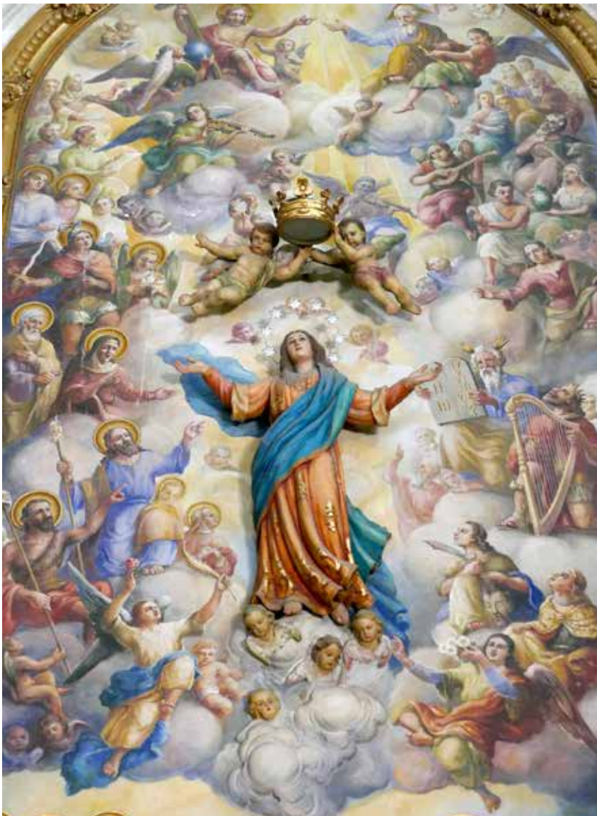
Am 15. August feiern wir das Fest „Mariä Aufnahme in den Himmel“

Lieber Männer vom Lindenberg, liebe Beter in Quarantäne, liebe Leserinnen und Leser der „Richtung“!