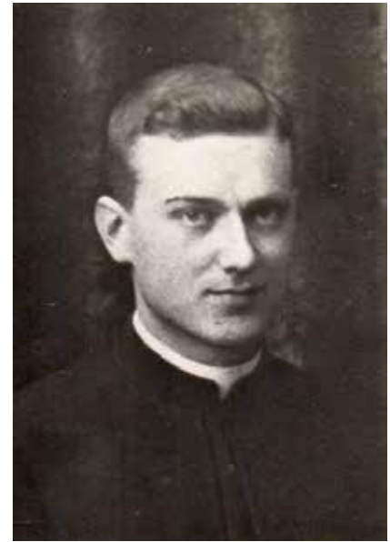
Der junge Priester Franz Reinisch

Wir sind vereint in der Erinnerung an einen Priester, der sich nicht vom Sog der Nazi-Ideologie mitreißen ließ. „Sein juristisch geschulter Blick durchschaute das verbrecherische Treiben bereits zu einer Zeit, als noch viele Gutgläubige dem Führer zujubelten“. Reinisch habe den Protest riskiert und nach einem Weg gesucht, den er vor seinem Gewissen verantworten konnte. Sein „prophetischer Protest“ in bedrängter Situation sei „für uns heute ein Vermächtnis und eine Herausforderung zu eigener Entschiedenheit“. Zum Tode verurteilt und hingerichtet, weil er seinem Gewissen treu bleiben wollte. Hingerichtet, weil er nicht Massenmensch sein, sich nicht entsprechend verhalten wollte, weil er mit klaren Worten die politische Führung kritisierte, weil er sich dem Druck nicht beugen wollte und standhaft blieb. Hingerichtet – ein Märtyrer der Gewissenstreue. Er ist uns Vorbild, dass auch wir heute klar und fest zu unseren Entscheidungen stehen müssen. Jeder Einzelne ist heute aufgerufen, zu schauen und zu hören, wo Gott ihn braucht, seine Sendung zu erkennen und diesen Weg dann konsequent zu gehen, auch wenn es Opfer von uns fordert. Wir beten um die baldige Seligsprechung Reinischs, damit dieses Beispiel weiterlebt. Pater Reinisch hat in seiner Zeit Zeichen gesetzt, Zeichen wie Menschsein, Leben und Glaube gelingt.