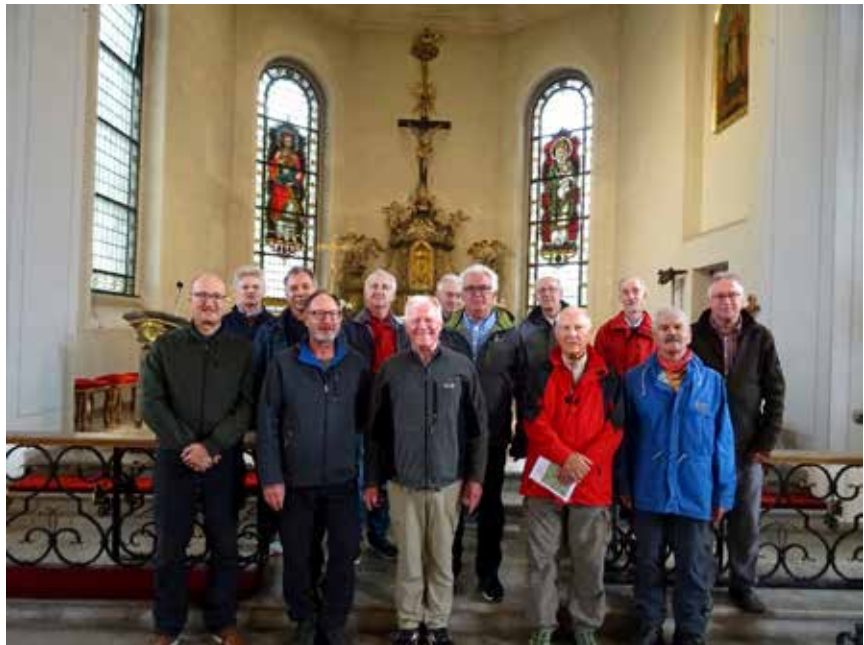
Fröhliche Gesichter der Pilger nach dem Abschlussgottesdienst in der Pfarrkirche St. Erhard in Hofstetten bei Haslach im Kinzigtal.

Der 3. Wandertag von Gengenbach nach Offenburg war eine Flachetappe. Der Start war bei fast trockenem Wetter aber noch starkem Wind. Bevor wir auf den Kinzigdamm liefen, suchten wir im Bereich einer Papierfabrik einen windgeschützten Platz, wo wir uns zum Morgengebet versammelten. Danach ging es weiter und in Höhe Ortsende Gengenbach entlang von Feldern, auf denen