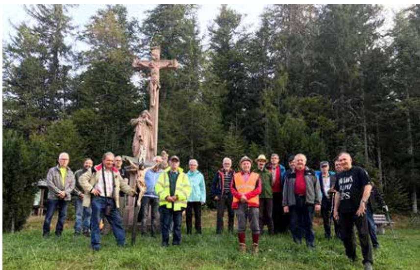
Die Wallfahrer bei der Station beim Ibacher Kreuz. Hier schlossen sich weitere 3 Fußpilger der Gruppe an.

Aufgrund des herrlichen Wetters fand sich nachmittags eine stattliche Zahl von Gläubigen an der neu errichteten Marienstatue zur Andacht mit Pater Roman ein.