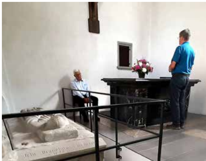
Bei der Grablege von Bruder Klaus in der Kapelle neben der Pfarr- und Wallfahrtskirche in Sachseln.