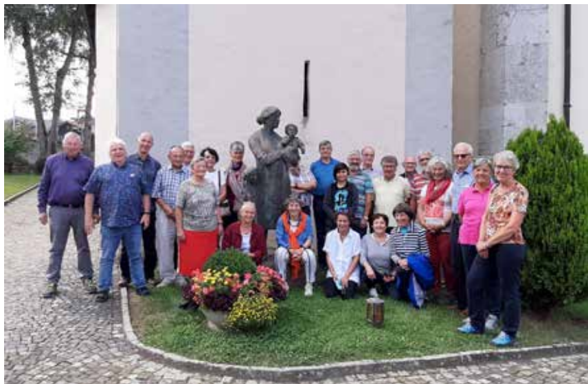
Gruppenbild aller Teilnehmenden der Wallfahrt bei der Statue von Dorothee Wyss, der Frau von Bruder Klaus.

Ein Regenguss zwang uns statt zu Fuß den Rückweg anzutreten