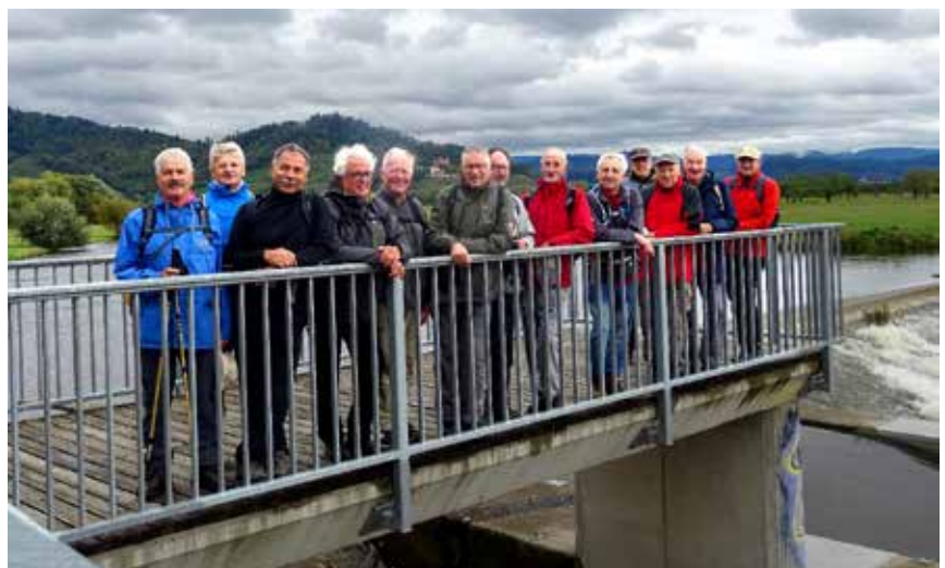
13 Wanderer haben das Ziel erreicht: Offenburg – an der Kinzig – Zum großen Deich.

Mit ruhigen, jeder nach seinem individuellen Tempo gesetzten Schritt, bewältigten wir den Aufstieg und waren froh und dankbar, uns in der Hütte, im Schutz vor Regen, Wind und Kälte, zur Brotzeit absetzen zu können. Nun führte der Weg auf einem schmalen Serpentinpfad und danach auf breitem Holzabfuhr-