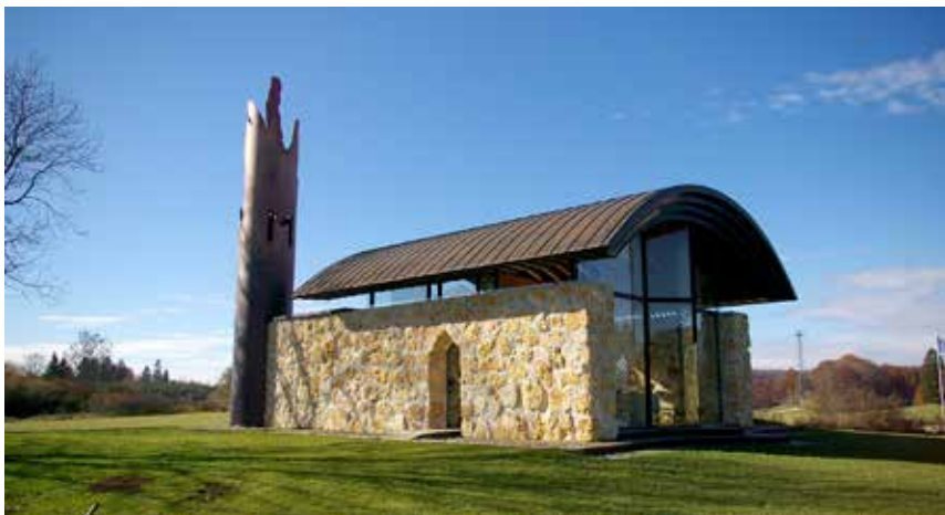
Kapelle Maria Mutter Europas auf Gnadenweiler bei Bärenthal/SSE Beuron