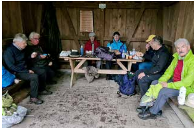
Brotzeit – nach dem Aufstieg von Nordrach zur Lärchenhütte

seinem Arm, aber der Junge schrie nur noch lauter. Schließlich musste man das kostbare Stück zerschlagen, um die Hand des Jungen zu befreien. So fand man den Grund, weshalb er die Hand nicht herausziehen konnte: In der Vase lag ein Geldstück – das hielt er fest in seiner Hand. Weiter über den Kohlplatz nach Zell a.H., wo wir die Wallfahrtskirche „Maria zu den Ketten“