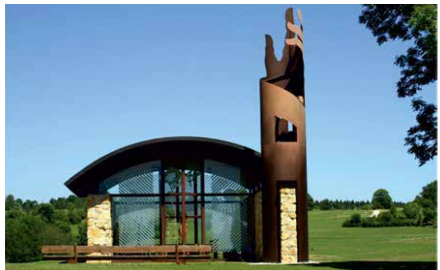
Kapelle „Maria Mutter Europas“ in Gnadenseiler

Um 09:30 Uhr begann das Konventamt. Der Hauptzelebrant war nicht der Abt sondern ein Pater. Leider waren die Mikrofone sehr schlecht eingestellt, so dass die Lektoren, die die Lesungen, das Evangelium und die Fürbitten vortrugen, kaum zu verstehen waren. Schade. Singen war, Corona geschuldet, natürlich auch untersagt. So gefeiert ist ein Gottesdienst wenig aufbauend. Nach dem Gottesdienst fuhren wir in das ca. 5 km entfernte Gnadenseiler. Dort wurden wir im Cafe Kapellenblick von den Wirtsleuten Krieger und Dreher bereits erwartet. Trotz der großen Zahl der Gäste konnten wir a la Carte essen. Ob Ziegenbraten, schwäbische Maulta-