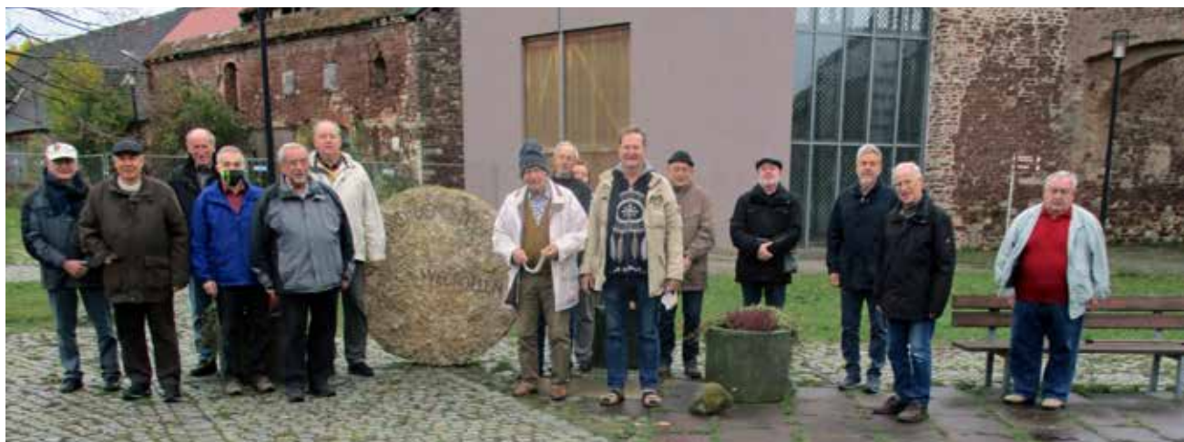
Gruppenbild aller Teilnehmer der diesjährigen Gebetswache im Kloster Helfta.

Die Existenz des Zisterzienserinnenklosters Helfta ist vorerst Dank einer engagierten und begnadeten Leitung nicht gefährdet, sowohl in zahlenmäßiger als auch wirtschaftlicher Hinsicht. Das Kloster ist christliche Oase in einer ansonsten heidnischen Wüste, aus der jedoch auch immer wieder hoffnungsvolle Signale von Suchenden kommen. Aber letztlich muss man erkennen, dass die DDR und Ihre „Staatsorgane“ in den 40 Jahren ihrer Existenz gründlich mit einer über 1000jährigen christlichen Kultur aufgeräumt haben, um den Marxismus-Leninismus