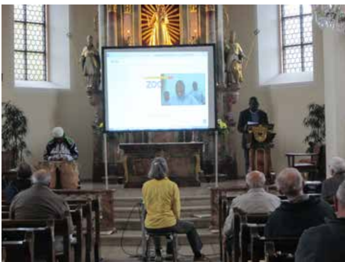
Vortrag und Videoliveschaltung nach Togo in der Wallfahrtskirche auf dem Lindenberg.

Mit einem gemeinsamen Abendgebet in den Anliegen der Weltmission und in Verbundenheit mit den Menschen in Togo endete dieser Nachmittag auf dem Lindenberg.