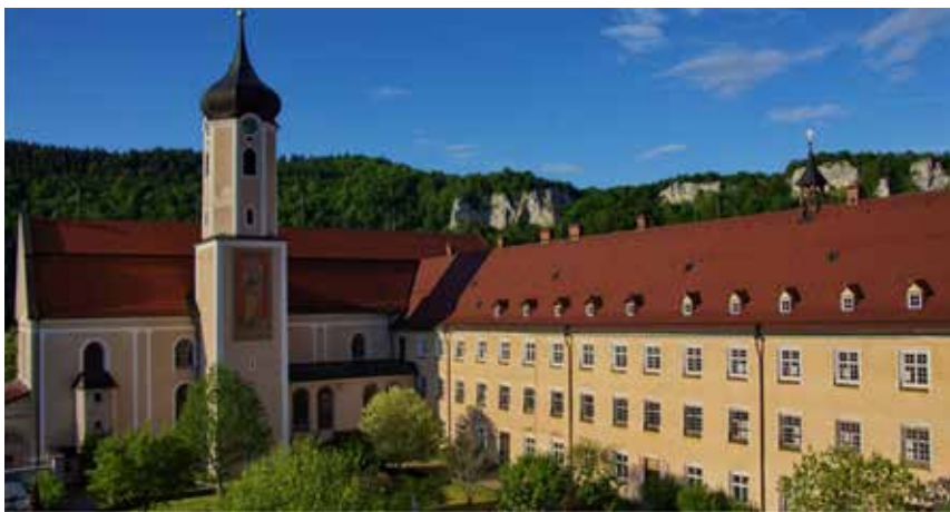
Ansicht des Kloster Beuron im Donautal