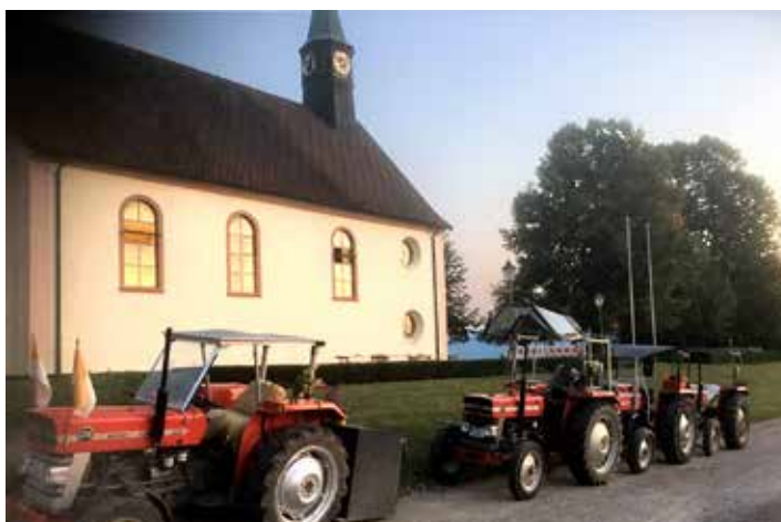
Die geparkten Traktoren neben der Wallfahrtskirche Maria Lindenberg. Einmal übernachteten die Wallfahrer im Gästehaus und fuhren am nächsten Tag wieder 5 Stunden zurück.