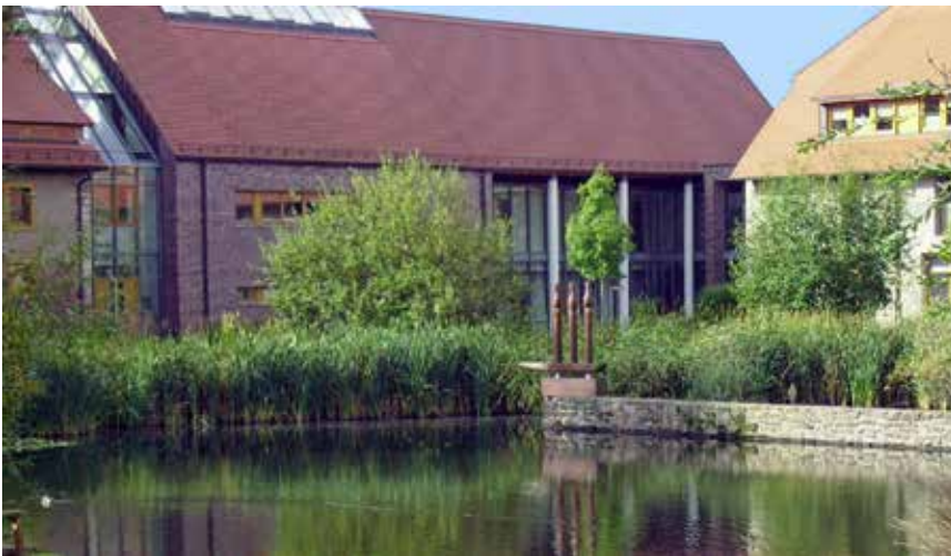
Der große Klosterhof mit den Statuen, die für die drei großen Frauen von Helfta stehen: Gertrud die Große, Mechthild von Hackeborn und Mechthild von Magdeburg

Es war kurz nach der Wende. Nachdem Freunde begeistert erzählt hatten von ihren Erkundungsfahrten in die ehemalige DDR, haben auch wir uns auf den Weg gemacht. Natürlich interessierten mich zuerst Juwelen wie der Naumburger Dom . Solche Bauten, Räume, betritt man nicht einfach, man beschreitet sie. Und ich gebe zu, dass ich, bei aller Ehrerbietung vor diesem Dom, vor allem das Bedürfnis hatte, eine Jugendliebe zum ersten Mal von Angesicht zu Angesicht sehen zu dürfen. Es ist die Uta , sie gehört, zusammen mit Ekkehart zu den Figuren des berühmten Naumburger Meisters . Und ihr Blick, dieser Blick, der ins Ewige taucht und noch mehr nach