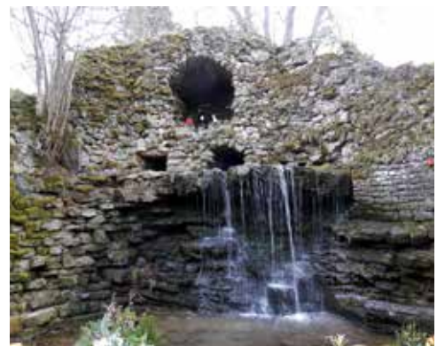
Lourdesgrotte ohne die Marienstatue, nachdem diese herausgerissen und in den etwa 3 Meter tieferliegenden Teich geworfen wurde und dabei völlig zerstört ist.

Bereits im Jahre 1888 wurde diese Lourdesgrotte vom damaligen Ortspfarrer Rohrer gegründet. Es ist bis heute ein bleibendes und anziehendes Denkmal bzw. Gebetsort für eine große Zahl von Betern, die dort der Himmelskönigin ihre Anliegen vortragen können. Vorerst soll eine Zwischenlösung als Ersatz für die Madonna erstellt