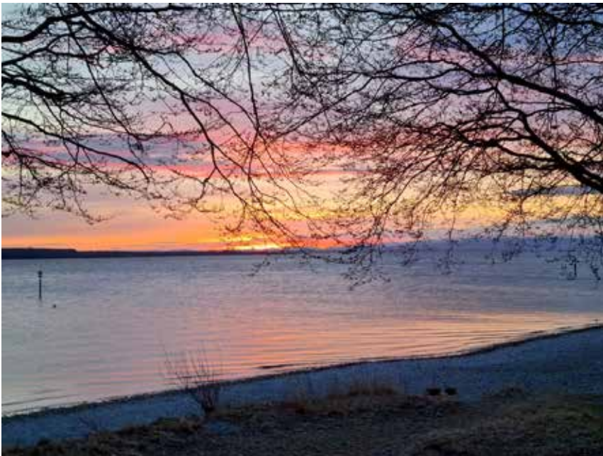
Sonnenaufgang am Bodenseeufer mit Alpenpanorama