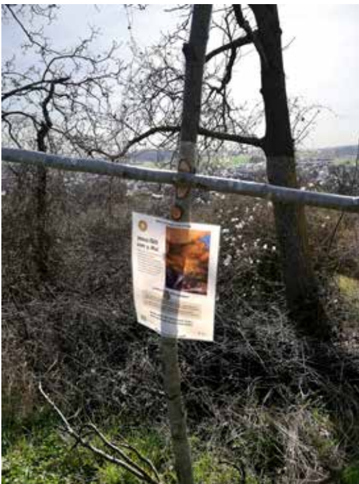
14 Stationen waren mit einem einfachen Holzkreuz und Bildkarte vom örtlichen Gemeindeteam gestaltet.