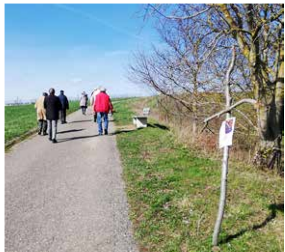
Weiter unterwegs zur nächsten Kreuzwegsstation.