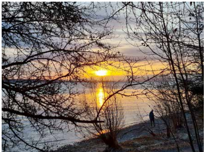
Blick zur Schweiz und Richtung Österreich

Lebensweg, den wir mit anderen teilen. Ein Weg liegt vor uns: Herr