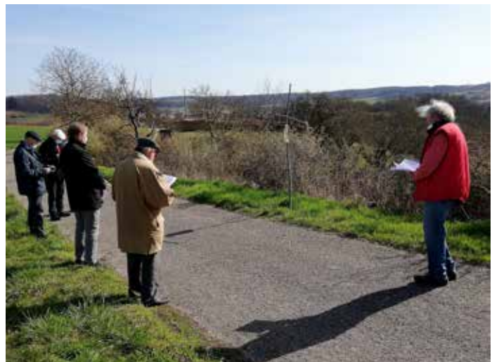
In kleinen Gruppen bei einer Station am Kreuz mit Impulsen und Gebeten.