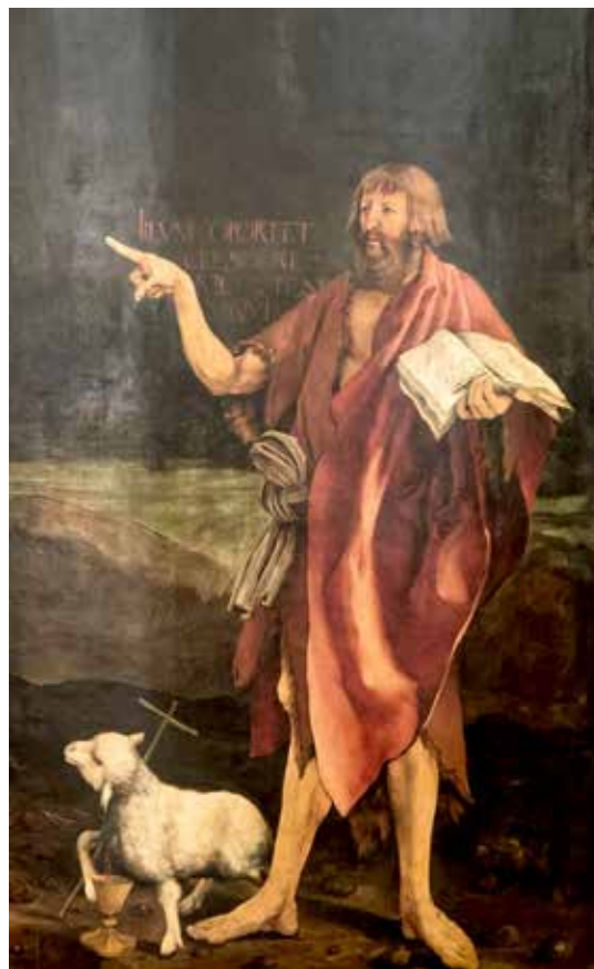
Bildausschnitt Isenheimer Altar im Unterlindenmuseum in Colmar. Johannes der Täufer zeigt auf den gekreuzigten Christus.

Juni. Der HIGH NOON des Jahres. Der Vierundzwanzigste. Heiße, das Feuer brennt. Sommersonnenwende. Feuer auf den Hügeln. Uralte Traditionen. Dated noch im alten Kalender. Von da an geht's bergab. Nach dem erreichten Höhepunkt kann es nur noch schlechter werden. Abnehmen ist angesagt. Bis zum absoluten Tiefpunkt. Dann wird aus der Wintersonnenwende neue Hoffnung sprießen. Der Gott des Lichtes wird geboren. – Die Kirche hat diese alten Rituale mit neuen Inhalten gefüllt. Sie wurde so zur Deutungsmacht ungewisser, verängstigter Naturreligionen, womit sie sich nicht nur Freunde gemacht hat. In Deutschland wurde damals schon einer erschlagen, weil er einen Baum gefällt hat, und zudem auch noch gewagt hat, Mission zu betreiben. Bonifatius konnte nicht ahnen, dass seine Vergehen 1300 Jahre später immer noch auf der roten Liste von Synodalen stehen. Praktiziertes Christentum bleibt offensichtlich auf Dauer ein Risiko. Sogenannte aufgeklärte Zeiten dulden es nicht. Was einen Widerspruch in sich darstellt. Dabei war das Christentum eine aufgeklärte Religion. Es hat die