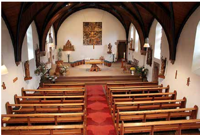
Jeden Abend trafen sie sich die Männer zu einer Gebetszeit in der Wallfahrtskirche