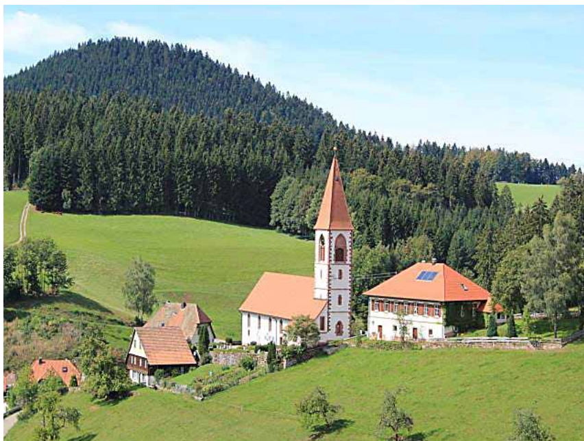
Wallfahrtskirche St. Roman oberhalb des Kinzigtales zwischen Wolfach und Schiltach

Manfred Eisenmann Fotos: SE an Wolf und Kinzig