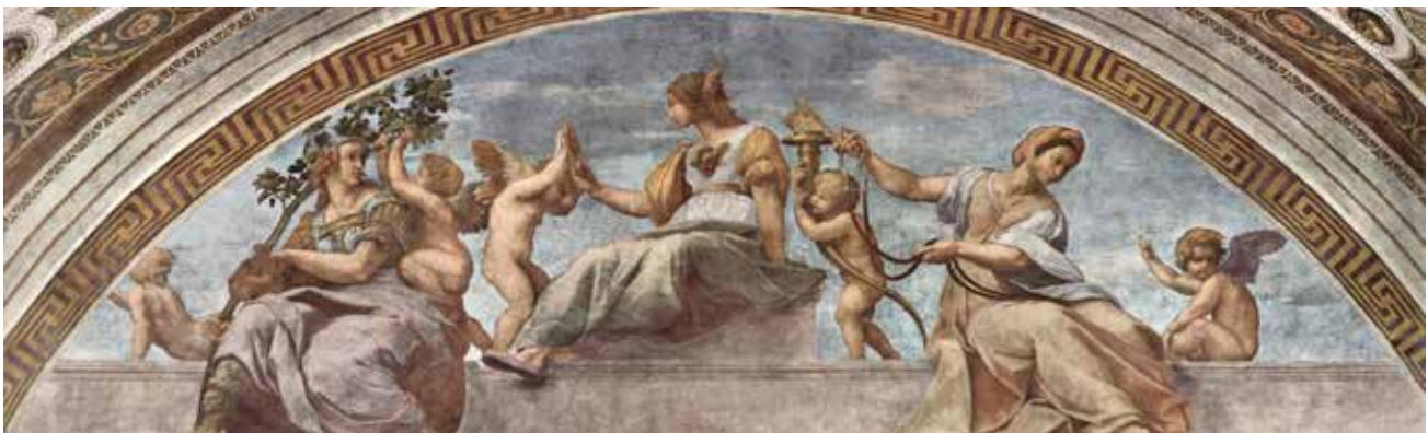
Detail aus „Die Kardinal- und Gottestugenden“ von Raffael, Fresko in den Stanzen des Raffael – Vatikanische Museen

Das Wort Tugend ist in unserer Sprache selten geworden. Wenn man Menschen befragt, was für Sie im Leben wichtig ist, wird das Ziel, ein tugendhaftes Leben zu führen, nicht mehr häufig benannt. In Zeiten von Platon, Aristoteles über das Buch der Weisheit (Weish 8,7) bis ins vergangene Jahrhundert war das anders. Ein tugendhaftes Verhalten von Menschen war eng mit der Würde und der Anerkennung eines Menschen verbunden. Das Wort Tugend kommt von „taugen“. Es geht um die Tauglichkeit und Fähigkeit eines Menschen, sich in diesem Leben zu bewähren. Tugenden sind Grundhaltungen, sittliche Aneignungen, die dem Menschen helfen in schwierigen Situationen Charakter, Größe und Demut zu entfalten. Eine erste systematische Ausformung erhält die Tugendlehre im Rahmen der Morallehre des Thomas von