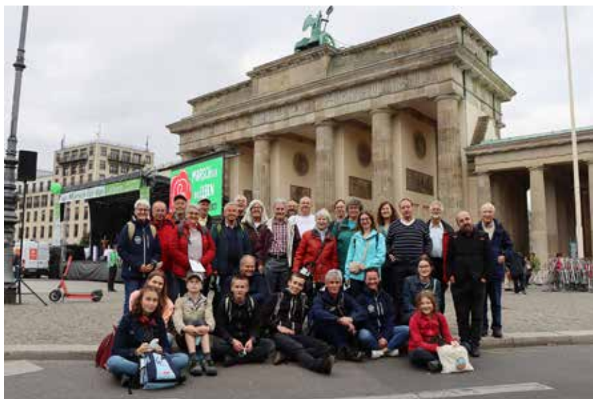
Teilnehmergruppe aus dem Dekanat Schwarzwald-Baar und darüber hinaus, die am Marsch für das Leben teilgenommen haben.