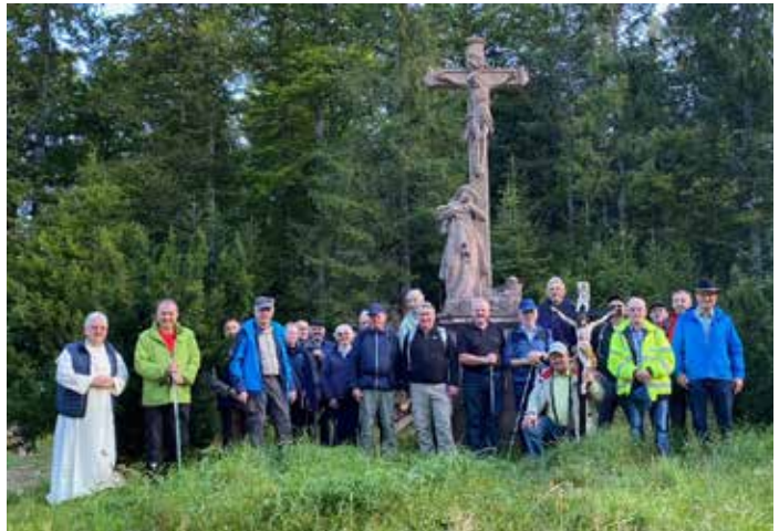
Gruppenbild während der Fußwallfahrt beim Ibacher Kreuz.

Aufgrund des herrlichen Wetters fand sich nachmittags eine stattliche Zahl von Gläubigen an der neu errichteten Mariensäule zur Andacht mit Bruder Roman ein.