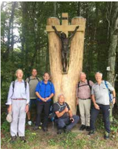
Teil der Wandergruppe vor einem neu errichteten Bildstock.

meinschaft bieten, sich um die Armen in aller Welt sorgen, z.B. in den Aktionen Misereor oder Adveniat“.) Kurze Zeit später erreichten wir, nach ca. 22 km statt der angegebenen ca. 19 km, das Etappenziel Mittelbiberach. In der Dorfkirche St. Cornelius und Cyprian mit dem Taufstein und einer Reliquie der seligen Ulrika versammelten wir uns zum Abendgebet. So konnten wir den 1. Wandertag in persönlicher Rückschau und in Dankbarkeit abschließen. Danach fuhren wir nach Bad Saulgau-Renhardsweiler wo wir im Gasthaus „Zum Hasen“ unsere Unterkunft bezogen und bei einem köstlichen Abendessen und geselligem Beisammensein den erlebnisreichen Tag abrundeten.