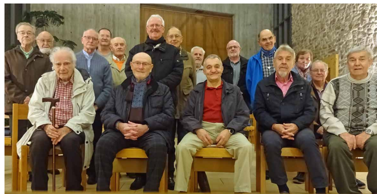
Abschlussfoto mit allen Teilnehmer der Gebetswache 2021 in Helfta

Text: Hartmut Lehmann