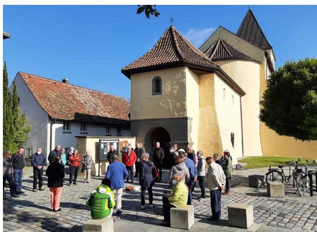
Vor der Kirche in Oberzell St. Georg – Insel Reichenau. Bekannt durch die gut erhaltenen Wandmalereien.