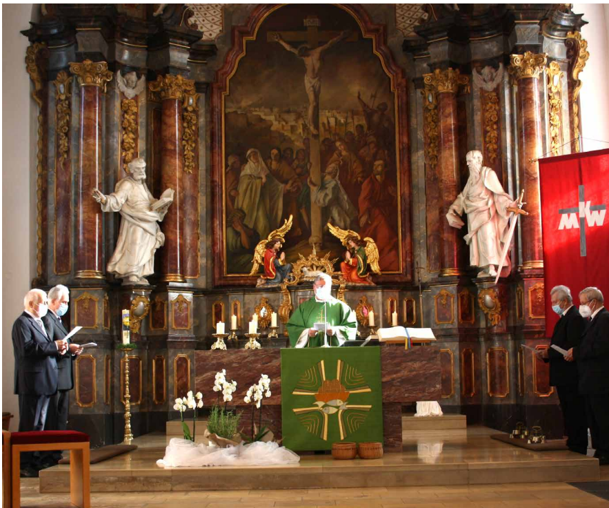
In der Kirche St. Pankratius fand der Jubiläumsgottesdienst des Kath. Männerkreises (KMK) Dossenheim statt.

Männerkreis Dossenheim feierte am 24.10.2021 sein 65. jähriges Bestehen