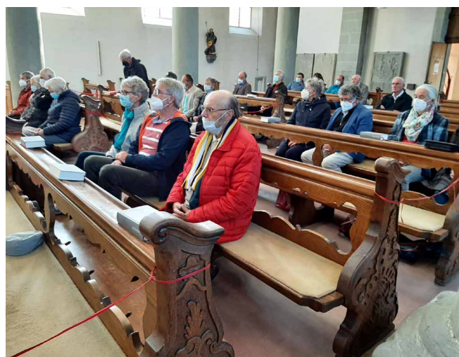
Beim Gottesdienst in Peter und Paul, Niederzell Insel Reichenau

Nach dem Gottesdienst traten alle Ausflügler nach einem wunderschönen, erlebnisreichen sonnigen Tag wieder ihre Heimreise an.