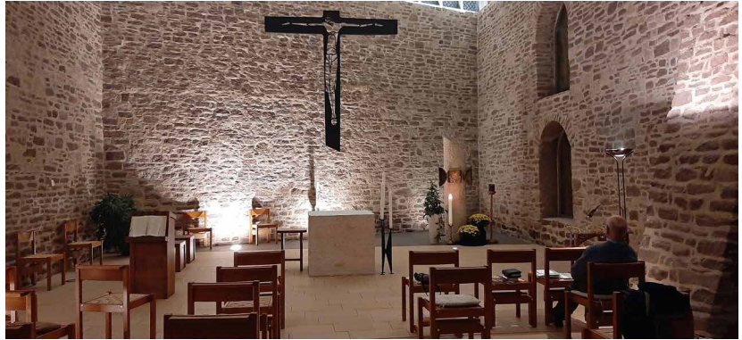
In der Anbetungskapelle finden die Gebetsstunden statt, die durchgehend Tag und Nacht von den Teilnehmern zu zweit wahrgenommen wurden.

Nach einer solchen Gebetswoche muss man feststellen, dass Glaube und Gebet sich einander bedingen. Folgendes Zitat von Karl Rahner fand ich im Gotteslob (im Anschluss an das Tedeum): "Glauben heißt, die Unbegreiflichkeit Gottes ein Leben lang auszuhalten." Das heißt doch, dass man ein Leben lang im Glauben wächst und diesem immer neue Dimensionen abgewinnt. Das heißt aber auch, dass dabei auch Glaubenszweifel auftauchen können, momentane Schwächen. Dabei übernimmt das Gebet eine wichtige Rolle. Es übernimmt die Kommunikation zum Gottesbild. Und wie ein Taucher von der lauten Oberfläche wegtauch, so versenkt sich der Beter immer tiefer in seinen Glauben und seine Gebete. Es wird mit zunehmender Tiefe immer stiller um ihn. Die Gnade Gottes kann dabei als hilfreiches Mittel angesehen werden, das es ihm ermöglicht, mehr und leichter an Tiefe zu gewinnen. Das Kloster Helfta trägt mit sei-