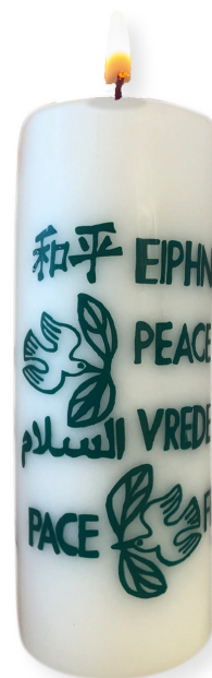
Das Gebet um Frieden in der Welt, ein wichtiges Anliegen auf dem Lindenberg.