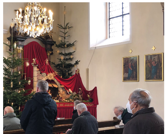
Beim Gottesdienst in der Wallfahrtskirche

berg fahren, gibt es immer wieder Personen, die einzelne Männer ansprechen und darum bitten, für ein besonders Anliegen in der Woche zu beten. Es wird bewusst wahrgenommen, dass die Beter auch für Ihre Gemeinden und deren Anliegen auf dem Lindenberg gehen. In diesem Jahr wurde besonders auch für die Menschen, die unter der Pandemie leiden gebetet.