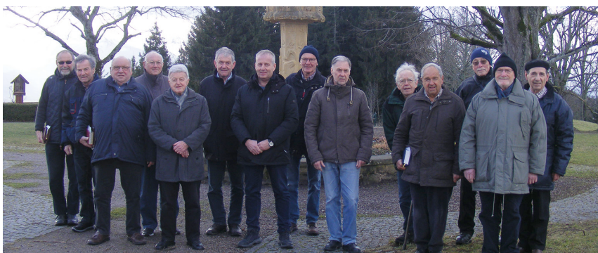
Gruppenfoto auf dem Platz vor der Wallfahrtskirche

Text: Rolf May-Seehars