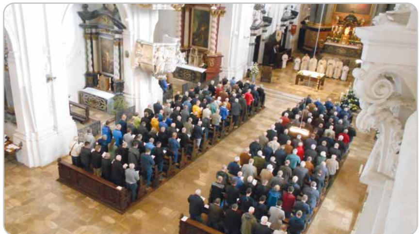
Blick in die barocke Wallfahrtskirche beim Gottesdienst

Text: Reinhard Haas