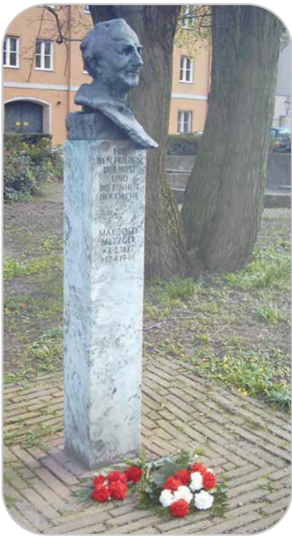
Max-Josef-Metzger-Stele beim Dom zu Augsburg

Wir brauchen diesen Mahner, der mit seinem Leben ein besonderes Zeugnis für die Würde und Freiheit des Menschen gegeben hat. Und uns obliegt es, in der heutigen Zeit, uns mit unseren Mitteln und Möglichkeiten für den Frieden einzusetzen, einen Frieden, der von Christus ausgeht und der stets in mir seinen Anfang nehmen muss sowie in den Herzen vieler, und der sich so zu einem gemeinsamen Frieden verstetigen will, in jedem Volk und in der Gemeinschaft der Völker, ja der gesamten Menschheitsfamilie.