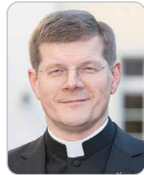
Erzbischof Stephan Burger