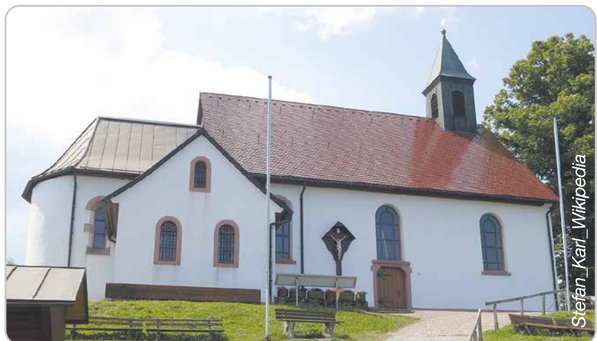
Wallfahrtskirche auf dem Hörnleberg

Nach einer Legende soll ein blinder Elsässer gelobt haben, auf jenem Berg eine Kapelle zu erbauen, den er nach seiner Genesung zuerst sehen werde. Er wurde erhört, und sein erster Blick fiel auf den Hörnleberg. Als versucht wurde, die Kapelle unten am Berg