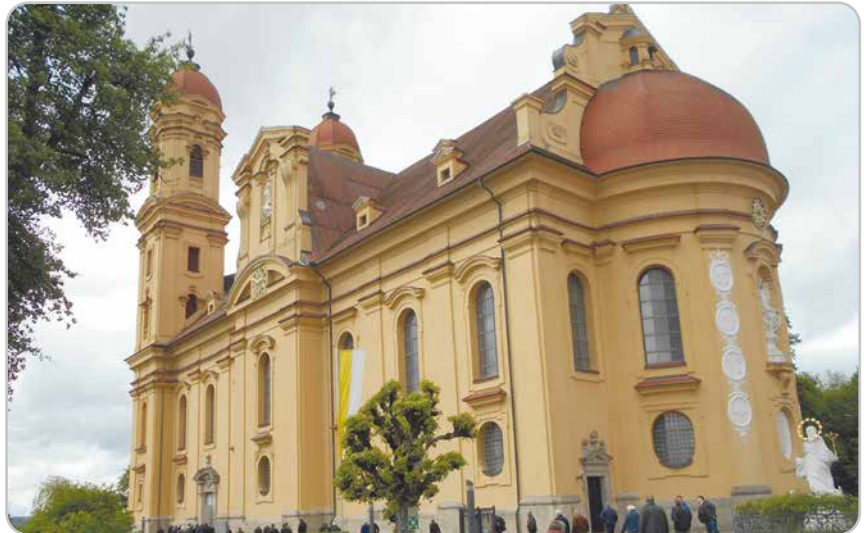
Von der Ellwanger Wallfahrtskirche „Schönenberg“ hat man einen wunderbaren Ausblick in das Jagsttal. Die Türme sind sogar von der A7 aus zu sehen.