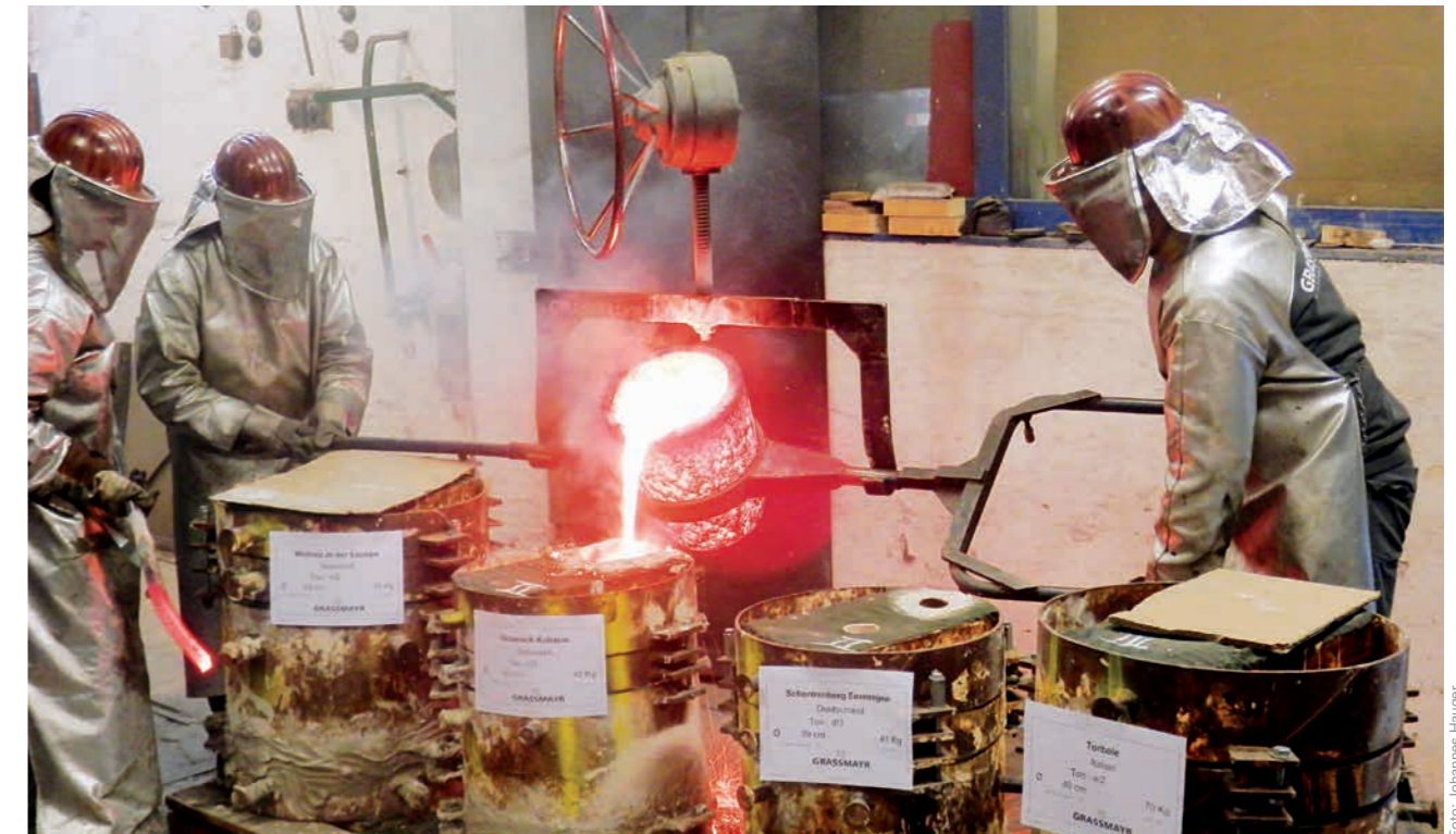
Ein historisches Moment in glühendem Metall. Die Teilnehmer beobachten gebannt den Guss der neuen Friedensglocke in der Werkshalle der Gießerei Grassmayr.