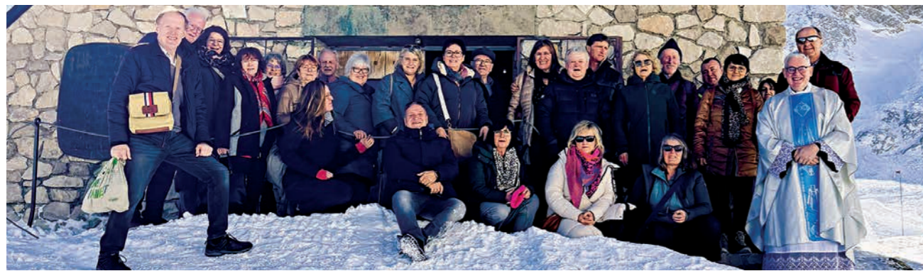
Nach dem Gottesdienst stimmten die Reisetilnehmer gemeinsam das Te Deum ‚Großer Gott, wir loben dich‘ an.