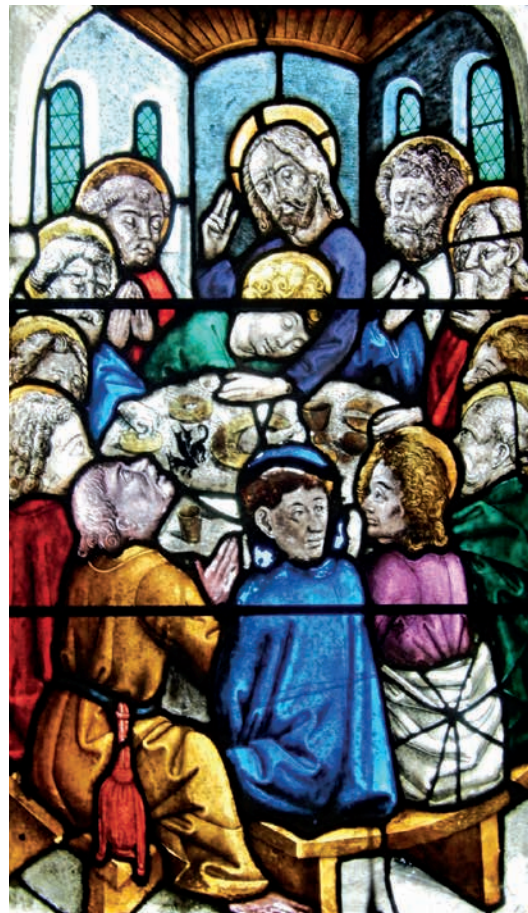
Abendmahlsdarstellung im Chor der Klosterkirche St. Walburga in Walbourg / Elsass

Ich stelle mir diesen Augenblick oft vor. Ich sehe Jesus vor mir, wie er das gebrochene Brot zwischen sich und seine Jünger hält und dabei diese Worte spricht. Ich stelle mir vor, wie alle erstaunt und erschrocken auf dieses Brot schauen. Sie hatten ja mitbekommen, wie im Lande die Stimmung gegen ihren Meister umgeschlagen war. Manche hatten seine dunklen Andeutungen von einem Kelch und einer