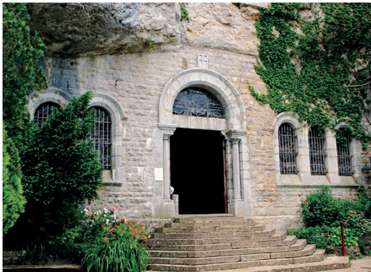
Eingang zur Grotte der Heiligen Maria Magdalena bei Sainte-Maximin-la-Sainte-Baume

Hier zeigt sich ein innerer Bezug zu Bruder Klaus von Flüe. Auch er zog sich in die Einsamkeit zurück und lebte