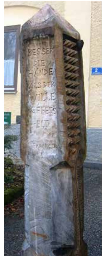
Denkmal für Jägerstätter in St. Radegund