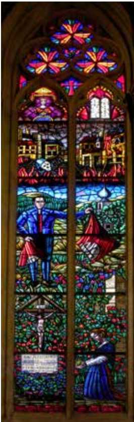
Franz Jägerstätter gewidmetes Fenster in der Wiener Votivkirche