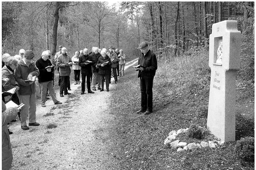
Bei der Wallfahrt des Katholischen Männerwerks auf den Schenkenberg beteten die zahlreich gekommenen Teilnehmer den Kreuzweg an den vierzehn Kreuzwegstationen.