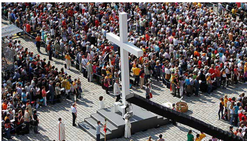
Das Bild zeigt den Schlussgottesdienst beim Katholikentag in Leipzig. Hier treffen sich Gläubige Christen aus Deutschland und anderen Ländern. Viele kommen als Einzelpilger, die meisten kommen aber zusammen mit Menschen aus ihren Verbänden, Vereinen oder charismatischen Gruppierungen.

Wer sich hie und da Zeit nimmt, um über solche Wirklichkeiten nachzudenken, der kommt fast automatisch zu einem Rückblick : „Was habe ich diesbezüglich erlebt?“ Vielleicht spürt er auch, wie frühe Erlebnisse sein Leben geprägt haben. Käme er dabei zu einem ehrlichen Resümee, dann würden wir das wohl „ Altersweisheit “ nennen. Das ist nicht ein nostalgisches, verklärtes Haften an Vergangenenem, sondern Wiederentdecken dessen, was man weitergeben will.