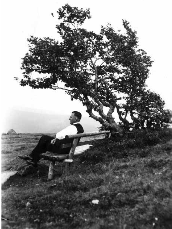
Windbuchen auf dem Schauinsland

davon beschrieben und dann Impulse zur Lebenszufriedenheit altgewordener Männer formuliert.