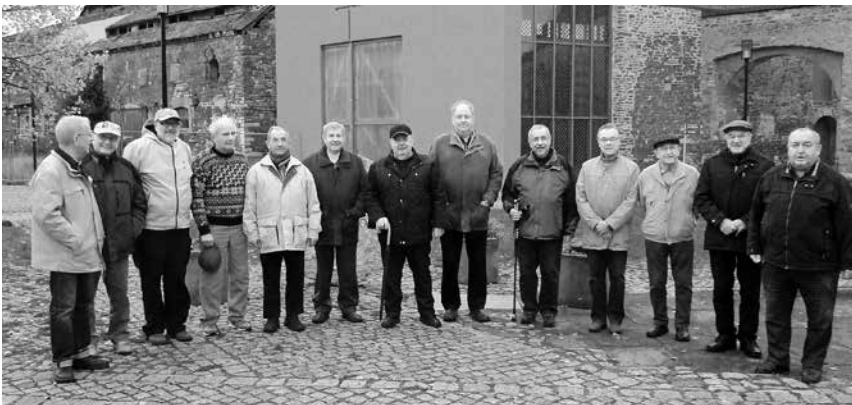
Viele der Teilnehmer sind treue Beter und waren bei allen sieben Gebetswochen dabei

genkraft erzeugt. Nun gibt es in den Erzählungen des Barons von Münchhausen das Gegenbeispiel dazu, wo sich der Baron, an seinem eigenen Zopf ziehend, selbst samt seinem Pferd aus einem Sumpf rettet. Führt man diese beiden Beispiele zusammen, so ergibt sich der denkbare Fall, dass man sich mit einem Bezugspunkt außerhalb der Erde aus einem Sumpf, sprich einer ausgewogenen Situation, retten kann.