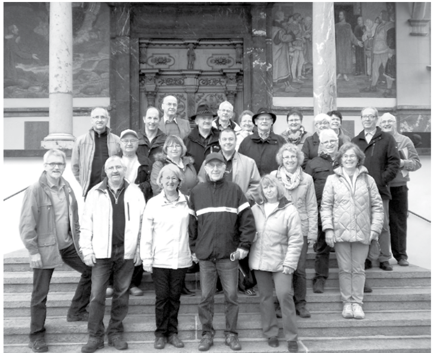
Die Pilgergruppe vor der Pfarrkirche in Sachseln

Nach dem Kofferpacken und dem Mittagessen nutzten die Pilger die freie Zeit, bis zum Reliquiensegen in der Pfarrkirche in Sachseln, mit einem weiteren Besuch in der Ranft