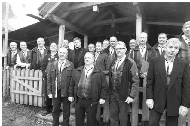
Die Sänger des Männergesangsvereins Ewatingen mit Erzbischof Stephan Burger vor der Marienkapelle auf der Alpe Klesenza

Auf 1594m liegt in einem Seitental des großen Walsertales die Alpe Klesenza.