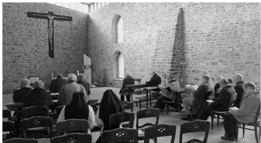
In der bemerkenswerten Kapelle herrscht eine beeindruckende Stimmung

Im nächsten Jahr ist die Gebetswoche in Helfta vom 14.–21. Oktober 2017