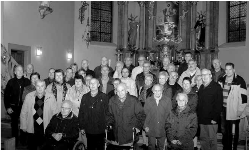
Die Teilnehmer am Herbsttreffen in der Pfarrkirche in Hettingen