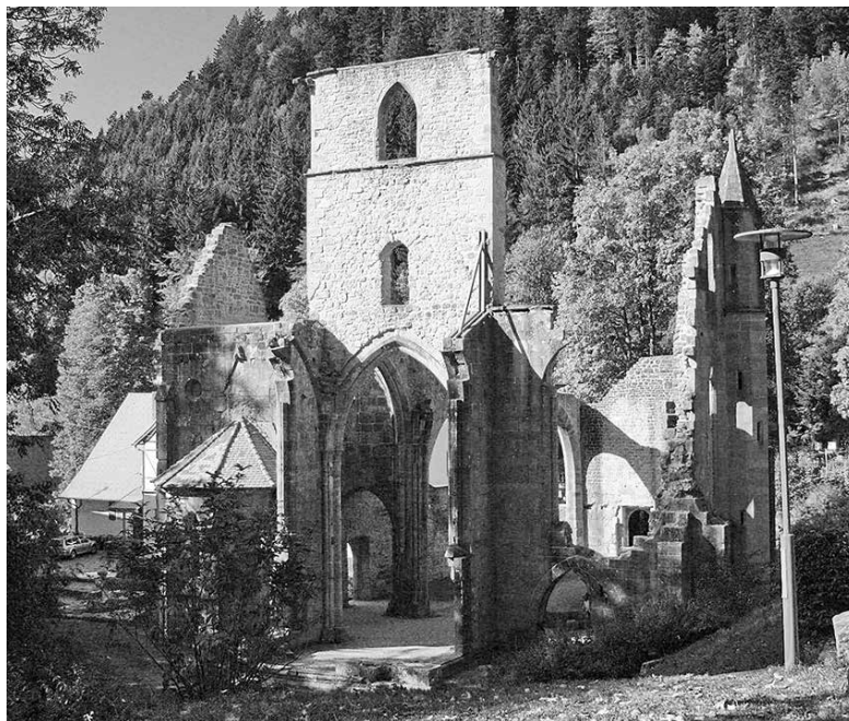
Ruine Allerheiligen – Schwarzwald Nationalpark

Wie vieles von meiner Kirche ist allein in der Zeit zerfallen, in der ich sie bewußt erlebe, und persönlich zu leben versuche. So vieles liebge-