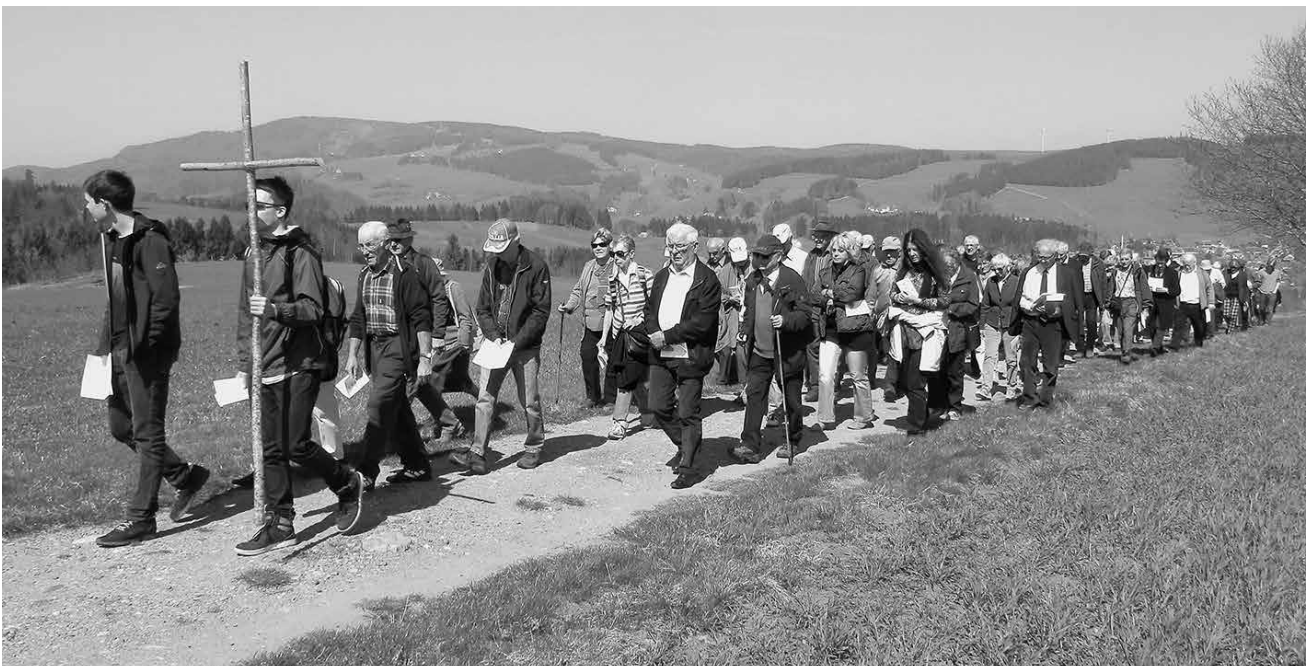
Eine große Betergemeinde mit rund 200 Pilgern machte sich auf den Weg, um über das Hochgericht den Kreuzweg zu beten.