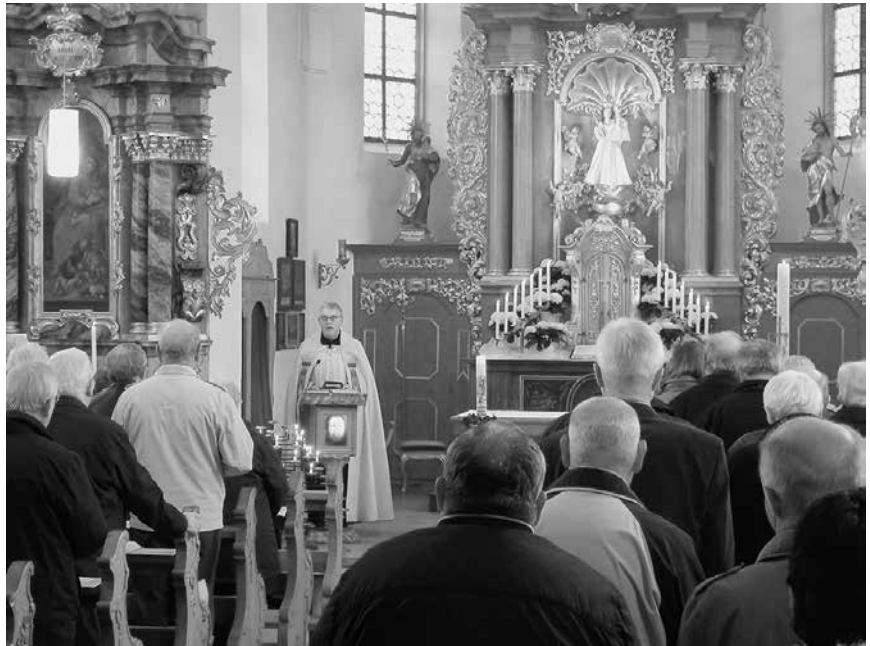
Blick auf den Hochaltar in der Kirche „Maria Opferung“ zu Schenkenberg bei Emmingen ob Egg. Zahlreiche Gläubige aus den drei Dekanaten Hegau, Konstanz und Schwarzwald-Baar waren gekommen.

Pater Rupert Mayer stammt aus unserer Heimat. Er wurde in Stuttgart geboren und wirkte als Vikar in Spaichingen und dann als Seelsorger in München. Pater Mayer war Präses der Marianischen Männerkongregation. Durch seine regen Tätigkeiten galt er schon bald als „Männerapostel“ und „Apostel Münchens“. Er hielt bis zu 70 Predigten pro Monat in München. Als 1933 Hitler an die Macht kommt, wendet sich Mayer in Predigten und Vorträgen mit deutlichen Worten gegen die Angriffe der Nazis auf die Kirche. Sofort gerät er ins Visier der braunen Machthaber. Mit seiner unbeugsamen Haltung trotzte Pater Rupert Mayer dem Hitler-Regime. Für ihn war schnell klar, ein Christ darf und kann nicht Nationalsozialist sein. Für seine klare Haltung gegen den Nationalsozialismus sperrt man ihn ins Konzentrationslager