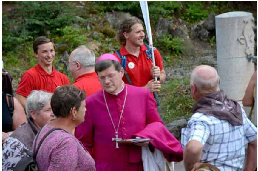
Erzbischof Stephan hat immer wieder das Gespräch mit den Pilgern gesucht.