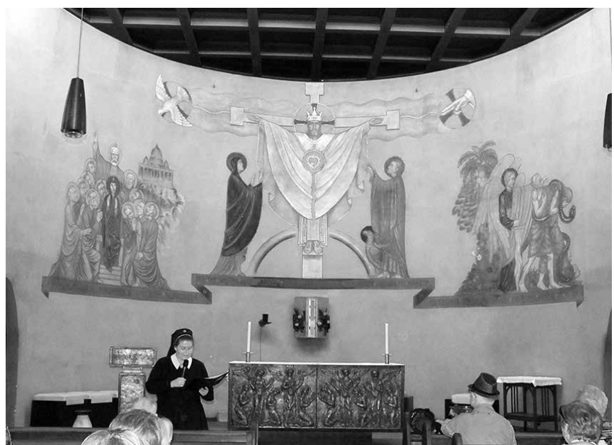
Ein besonderes Erlebnis war die Andacht mit Führung in der früheren Hauskapelle. Das Mosaik ist aus den Anfängen des 19. Jahrhunderts.