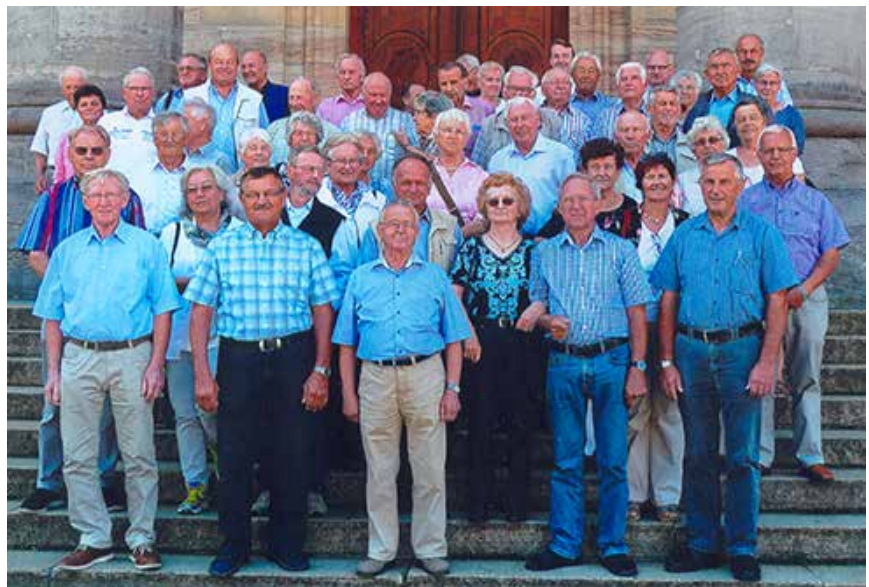
Die Teilnehmer an der Wallfahrt nach St. Blasien vor dem Dom

von Rothaus stehenden Biertanks und die surrenden, unter den Flaschen scheppernden Förderbänder aus Edelstahl beobachteten, war ihnen nichts fremd. Nur ein Unterschied wurde ihnen zwischen der Wein- und Bierherstellung klar: Wein gibt es nicht ohne die so viel