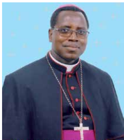
Son Excellence Monseigneur Prosper KONTIEBO Evêque de Tenkodogo

Donnerstag, 19. Oktober 2017 kommt Bischof Prosper Kontiebo auf den Lindenberg. Um 15:00 Uhr wird er im Pilgersaal einen Vortrag halten. Im Anschluss ist eine Vesper in der Wallfahrtskirche.