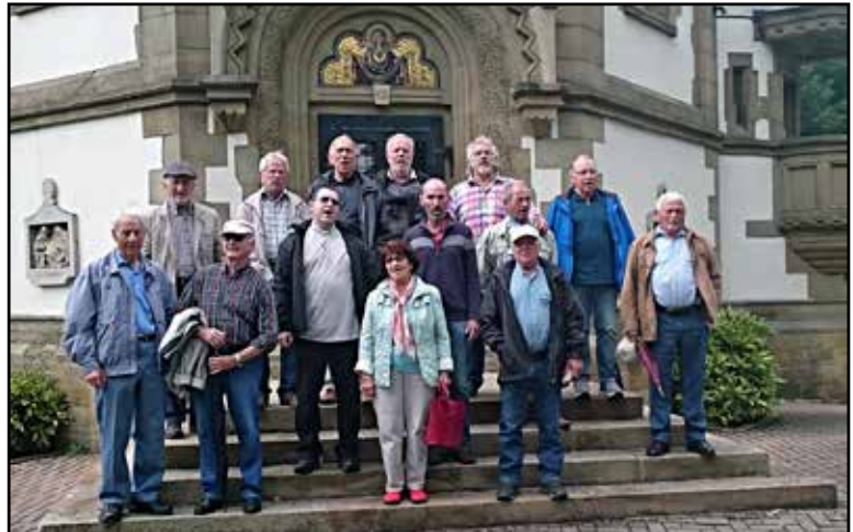
Die Teilnehmer vor der Wallfahrtskirche auf dem Letzenberg