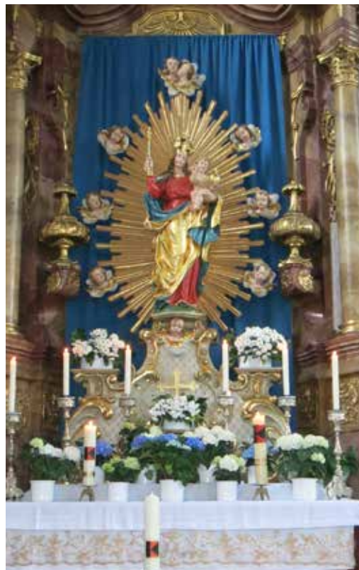
Maialtar in St. Margarethen, Waldkirch von Stephan Kälble, 1958

Letztendlich wird dieser Titel der Gottesmutter bereits seit Jahrhunderten verwendet, er ist auch in der Lauretananischen Litanei enthalten und wurde bereits in den frühen christlichen Gemeinden verwandt. In dem Dekret wird deutlich gemacht, dass Maria zugleich Mutter Gottes als auch Mutter der Kirche ist. Beim Betrachten des Geheimnisses Christi und des Wesens der Kirche kann Maria als wichtige Frauengestalt in unserem Glauben nicht vergessen werden.