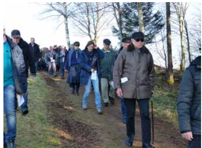
Zur Wallfahrt vom Muggenhof zum Lindenberg bei St. Peter im Schwarzwald sind bei schönem Frühlingswetter 150 Christen zusammengekommen, um in den Anliegen der Menschenwürde und für den Lebensschutz an den 14 Kreuzwegstationen zu beten