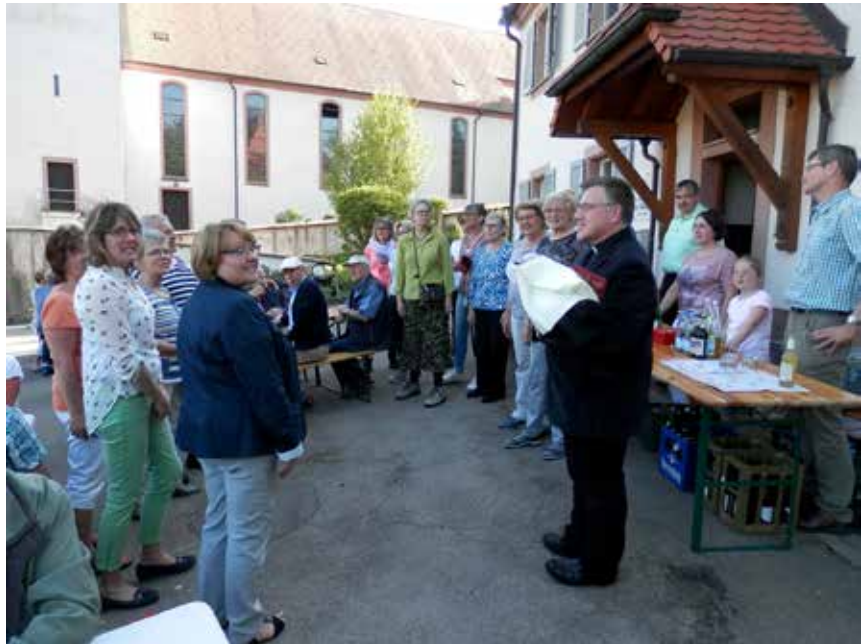
Nach der feierlichen Maiandacht sind die Gäste vom Kirchenchor Weilersbach im Pfarrgarten neben der Kirche bestens mit Kaffee und Kuchen versorgt worden

In seiner Predigt stellte Pfarrer Michelbach die Worte Jesu in den Mittelpunkt: „ Mein Reich ist nicht von dieser Welt “. Es ist wichtig, den Blick nach vorne zu richten auf das Wesentliche. Gerade in der Bedrängnis ist es wertvoll zu wissen, dass Gott immer da ist. Viele Chris-