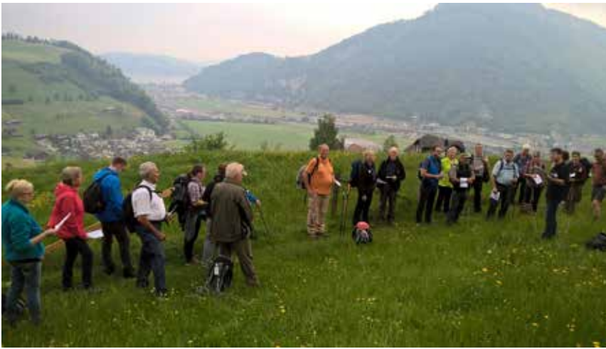
Die Fußpilger haben an den einzelnen Stationen geistliche Impulse zum Thema miteinander geteilt

Haus, Ihren Garten, Nachbarn und Ihr Dorf oder Stadt zurückgelassen, um Ihren Glauben, Ihre Beziehung zu Gott aufzufrischen und neue Kräfte zu sammeln. Diese Wallfahrt steht unter dem Motto: Wach auf meine Seele! Lassen wir uns von Gott aufwecken, aufrütteln. Werfen wir Ballast ab und suchen einen neuen Zugang zu unserer Seele!