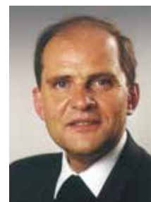
Msgr. Wolfgang Sauer

Die eingangs erwähnten romanischen Sprachen kennen die Formulierung „sens unique“ oder „senso único“: gemeint sind die Einbahnstraßen. Die Entdeckung eines sinnerfüllten Lebens folgt jedoch nicht den Gesetzmäßigkeiten der Einbahnstraße, einer zur Tretmühle geratenen Ausrichtung unseres Lebens. Das Spiel des Hin und Her, die Variabilität unserer Interessen und „Richtung“ sind der Reichtum eines Lebens. Wenn wir dies aus dem Blick verlieren, sind wir nicht nur in einer Einbahnstraße gefangen, sondern landen am Ende womöglich in einer Sackgasse. Dafür jedoch ist unser Leben viel zu kostbar.