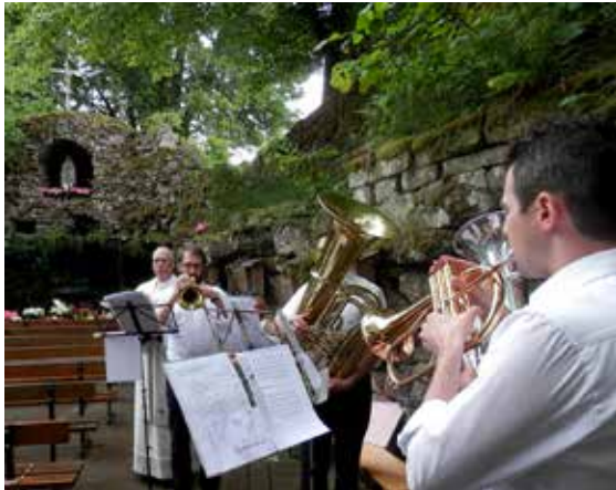
Musikalisch hat die Bläsergruppe Obereschach die Maiandacht in der Gebetsstätte Elsenau umrahmt.