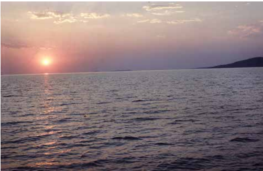
Abendruhe am Bodensee – Zeit zum Entspannen

Wenn wir den Begriff und Titel der „richtung“ in den romanischen Sprachen identifizieren, ergeben sich die Worte „sens“ oder „senso“, die dann nicht nur „Richtung“, sondern auch „Sinn“ meinen. Immer geht es uns Menschen in unserem Tun und Lassen um den Sinn, letztlich um den Sinn unseres Lebens. Auch dort, wo wir uns die Richtung vom „Un-Sinn“ oder gar „Blöd-Sinn“ vorgeben lassen, können wir der Tatsache nicht enttrinnen, dass auch das vermeintlich Sinnlose einem Interesse folgt, und dass die Aus-Richtung unseres