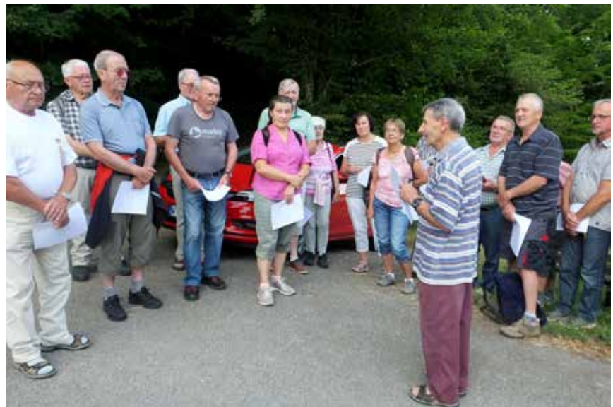
Auf dem Weg zu Fridolinskapelle machte die Gruppe an verschiedenen Punkten, wie markanten Wegekreuzen Station, um für den Frieden in der Welt zu beten.

projekte wurden unter seiner Federführung realisiert. Nach Beendigung des Bittgangs, welcher nicht nur ein geistiges, sondern mehr noch ein körperliches Tun war, saß die Gruppe, noch bei einer Stärkung und Erfrischung zusammen und lies den Abend in gemütlicher Runde ausklingen.