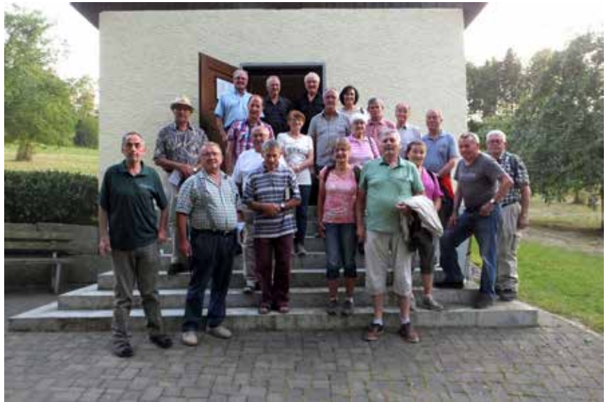
Die Fridolinskapelle in Obereggingen war das Ziel der Abendfußwallfahrt des Katholischen Männerwerkes des Dekanatsbezirks Klettgau/ Wutachtal.