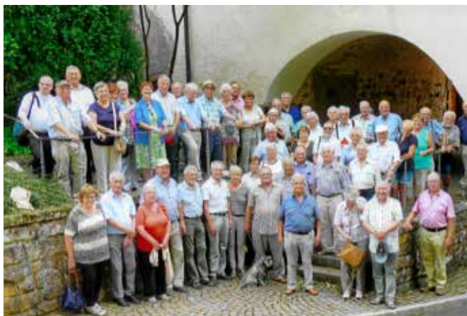
Groß war die Zahl der Wallfahrer vom Kaiserstuhl, die einen erlebnisreichen Tag im Kloster Wittichen bei der seligen Luitgard und in Wolfach verbrachten