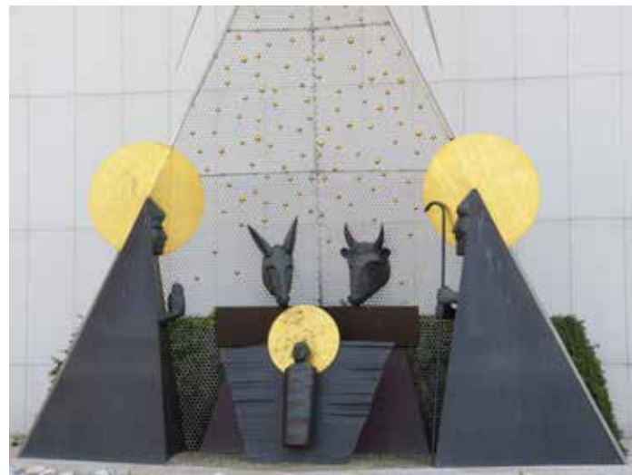
Krippe in Fatima

Die christlichen Feste im Kirchenjahr wollen Frei-Räume eröffnen, damit