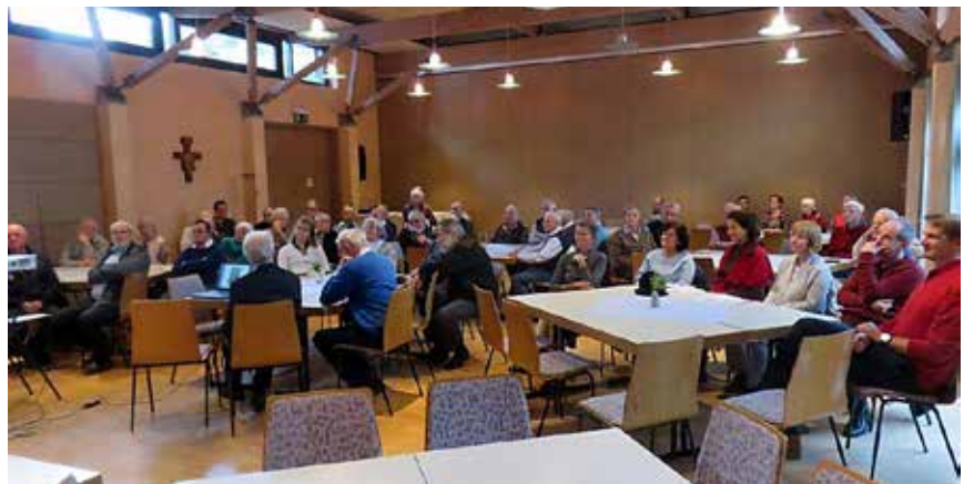
Viele Gäste nahmen an dem Einkehrnachmittag in Ziegelhausen teil

Im Jahr 540 in Rom geboren entstammte Gregor einem berühmten Patriziergeschlecht. Der Weg zu