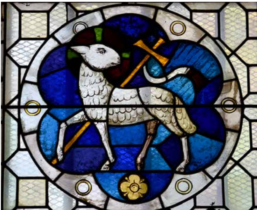
„Osterlamm“ Ottmarsheim, Kirchenfenster