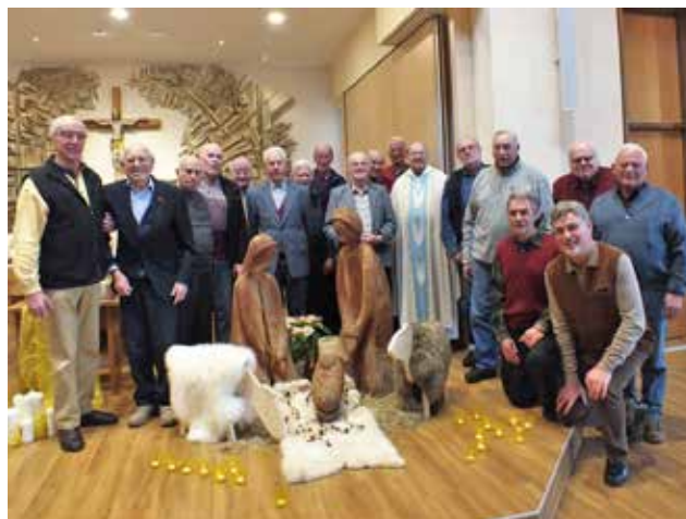
Die Teilnehmer an den Besinnungstagen nach dem Festgottesdienst zu Maria Lichtmess

Neben den Vorträgen gab es Gottesdienste mit Predigt, dazu Gebetszeiten und geistliche Angebote, die von den Männern selbst gestaltet