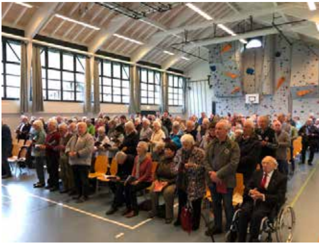
Die Wallfahrtsgemeinde während der Eucharistiefeier