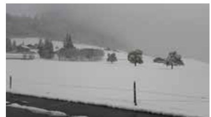
In diesem Jahr erlebten wir zum ersten Mal das tiefverschneite Flüeli