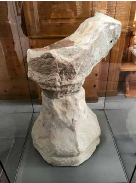
Reste des Taufsteins in der Pfarrkirche in Kerns. Hier hat Bruder Klaus das Sakrament der Taufe empfangen.

„Verleih deinem Knecht ein hörendes Herz, damit er dein Volk zu regieren, und das Gute vom Bösen zu unterscheiden versteht.“