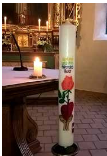
Die Wallfahrtskerze wurde wieder von Waltraud Giesen, passend zum Thema, gestaltet