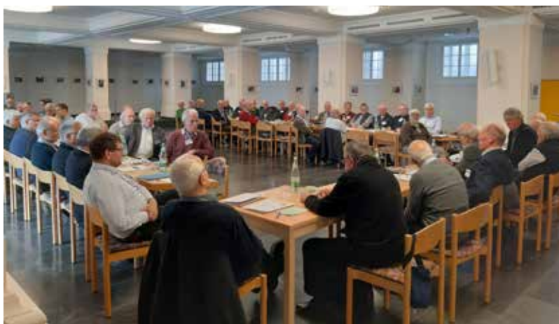
Blick in die Versammlung der Obmänner