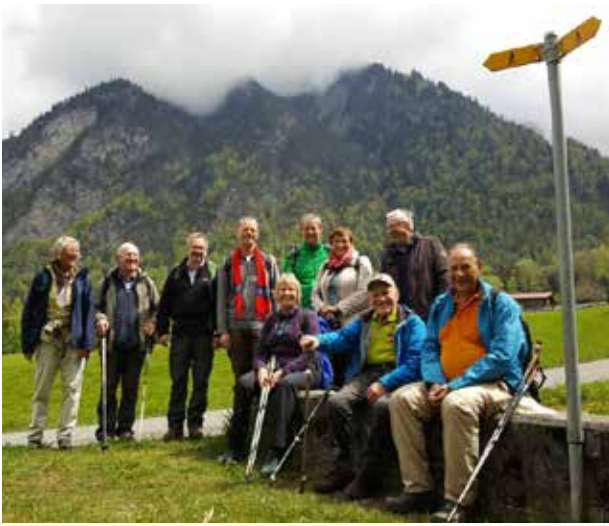
Einige der Fußwallfahrer ließen sich durch das schlechte Wetter nicht von ihrem Pilgerweg abhalten.