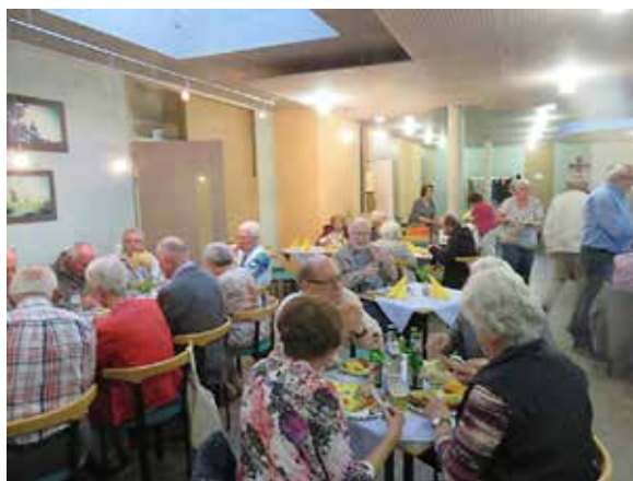
In gemütlicher Runde beschlossen die Anwesenden den Abend

Über ihren persönlichen Glückszustand hinaus sprach sie prophetische Worte, über die im Argen liegenden sozialen Verhältnisse und Gegensätze, zwischen arm und reich, Niedrige und Mächtige. Um die Macht der geistigen Kirche (Papst) und der weltlichen Seite (Kaiser) ging es Jahrhunderte lang