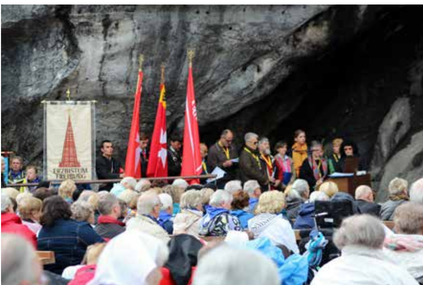
Beim Gottesdienst in der Grotte die Teilnehmer aus der Diözese Freiburg und aus der Gemeinschaft der Malteser