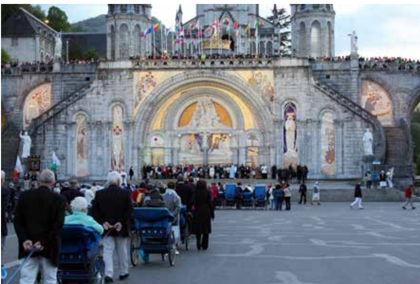
Eine Reisegruppe mit Kranken vor der Basilika in Lourdes

Die „Richtung“ – wartet auf Worte, wieder einmal. Was steht an? Der Sommer. Pfingsten vor der Tür, also Feuer und Geist. Der Marienmonat liegt hinter uns. Und neben mir auf dem Boden wartet der Koffer für die nächste Fahrt. Unsere Krankentour nach Lourdes steht an. Für mich die 39. dieser Art. Vielleicht erzähle ich Ihnen davon, einfach von dem, was viele kennen, aber vielleicht nicht aus meiner Perspektive.