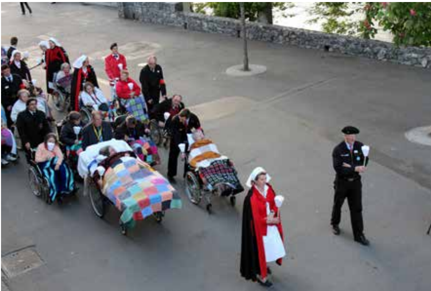
Die Kranken werden bei der Lichterprozession begleitet

dann heißt das, dass die Kranken in ihren Fahrstühlen dort hin gefahren werden müssen, zuvor angezogen und in die Wägelchen verladen, zuvor ihr Frühstück bekommen, zuvor geweckt und gewaschen werden, davor geht das Team ins Hospital, nachdem es sich im Hotel zu Frühstück und Morgengebete getroffen hat, was bedeutet, dass wir etwa um 4:00 Uhr früh aufstehen dürfen.