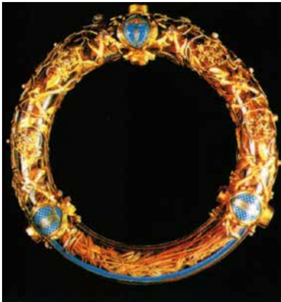
Das kostbare Reliquiar mit den Zweigen der Dornenkrone Christi