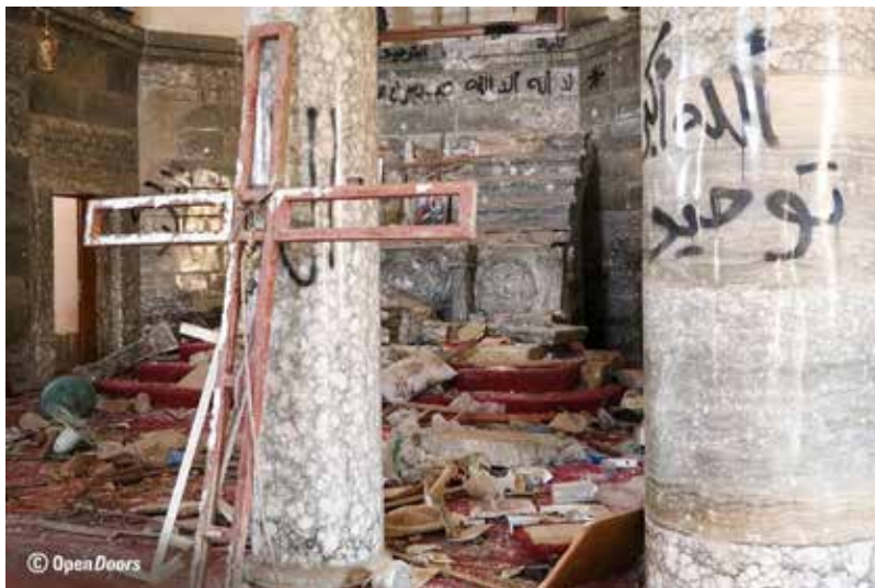
Verwüstung nach einem Anschlag auf eine christliche Kirche.

Wir müssen uns fragen, warum eine Religion der Friedfertigkeit, die geprägt ist vom Geist der Seligpreisungen und von der Weisung der Feindesliebe, in all den Jahrhunderten und bis heute bisweilen entfesselte Reaktionen der Verachtung und des Hasses gegen sich ausgelöst hat. Vielleicht ist das Wort des zum Paulus bekehrten Saulus ein Schlüssel zur Beantwortung „Wir verkündigen Christus den Gekreuzigten: für Juden ein empörendes Ärgernis, für Heiden eine Torheit“ (1 Kor. 1,23).