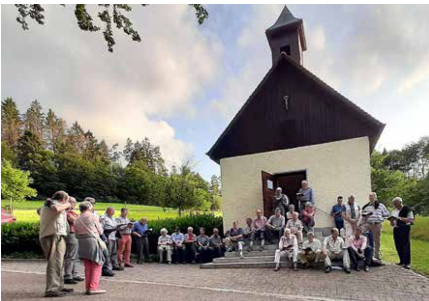
Zur Abendandacht trafen sich Männer und Frauen an der Fridolinskapelle

Gleichberechtigung der Frauen nicht vorankomme und Papst Franziskus mit seinen Ideen sich im Vatikan zu wenig durchsetzen könne. Stoll wünschte dem Männerwerk eine gute Zukunft und vor allem, dass für ihn bald ein Nachfolger gefunden wird. Mit lang anhaltendem Beifall drückten die Anwesenden ihre Verbundenheit, ihren Dank und Zustimmung zur Haltung ihres scheidenden Obmannes aus.