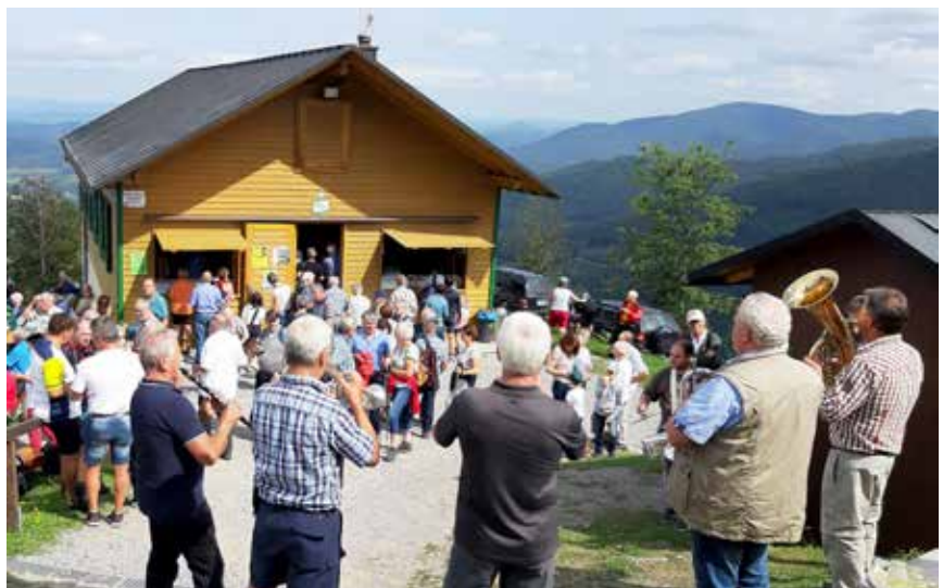
Die Hislimusikanten spielten während des Gottesdienstes und haben im Anschluss auf dem Berg die vielen Wallfahrer mit ihren Weisen erfreut.

ne in ihm sich zu verhalten haben, es geht um die Haus- und Tischordnung Gottes. Entscheidend ist