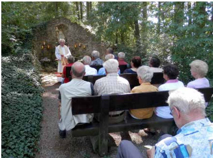
Viele Besucher kamen zur Marienfeier