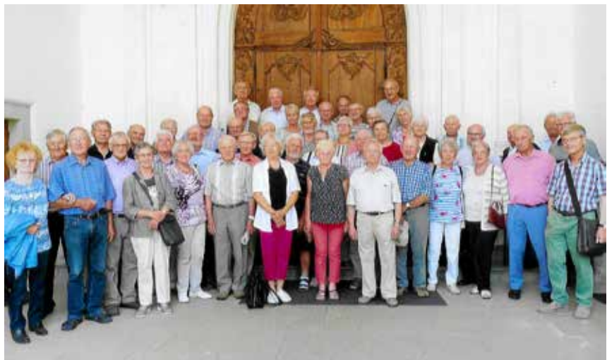
Die Teilnehmer vor dem Münster in Bad Säckingen