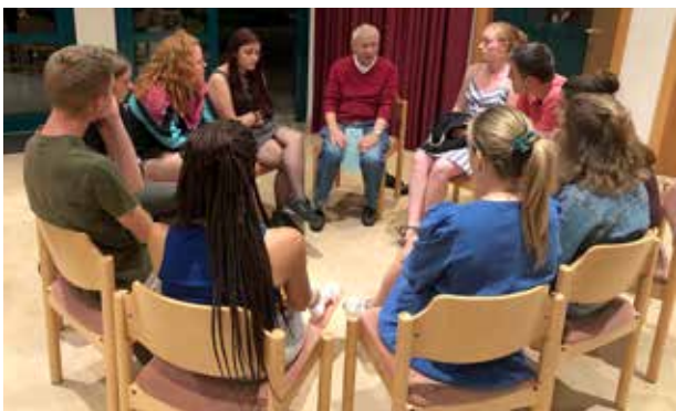
Freiwillige im Gespräch mit Männern der Gebetswache

dreier-Grüppchen tauchten sie in der Kirche auf, ließen sich auf das Gebet ein und wurden von den Männern herzlich willkommen geheißen. „Was sind eure Vorstellungen von Anbetung?“ „Wie lebt ihr Spiritualität im Alltag?“ „Und wie habt ihr sie im Freiwilligendienst erlebt?“ Die gemeinsamen Stunden der Anbetung sind kurzweilig und abwechslungsreich. Freiwillige und Männer bringen Ihre Anliegen und Gebetsformen ein und führen interessante Gespräche. „Ich war überrascht, wie offen die Männer uns gegenüber waren. Und wie herzlich sie uns in die Gebetswache aufgenommen haben. 24 Stunden lang ununterbrochen Gebet – das beeindruckt mich wirklich“ resümiert eine Freiwillige die Erfahrung. Der Abschied voneinander ist herzlich. Für die Männer ist ihre jährliche Lindenbergwoche vorüber, für die Freiwilligen bedeuten die Tage auf dem Lindenberg den Abschluss ihres Dienstes. Aber das Engagement für Frieden und Gerechtigkeit geht für beide Gruppen in ihrem Alltag weiter.