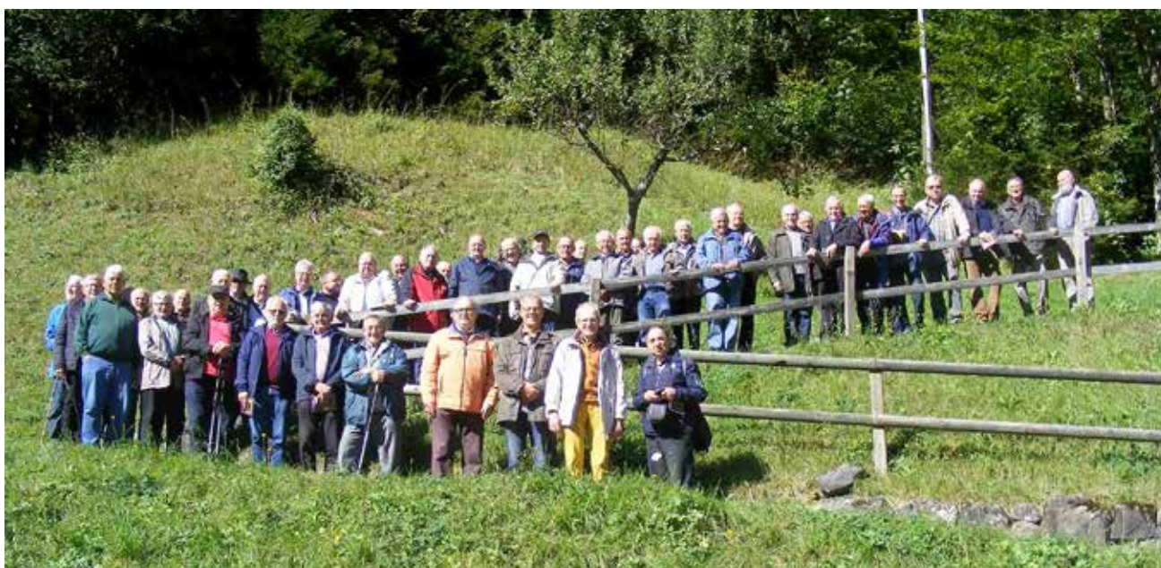
Gemeinsam unterwegs auf den Spuren des Heiligen Bruder Klaus – Gruppenfoto bei einer der Pilgerstationen