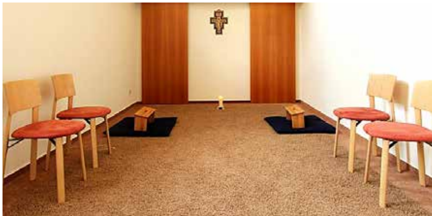
Die Gebetszeiten finden im Oratorium, dem Meditationsraum des Hauses Maria Lindenberg und in der Wallfahrtskirche statt.