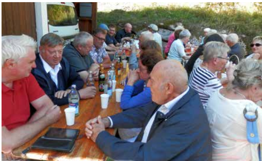
Zur Begegnung und Gespräch trafen sich die Pilger in froher Runde zum Abschluss des Kapellentages