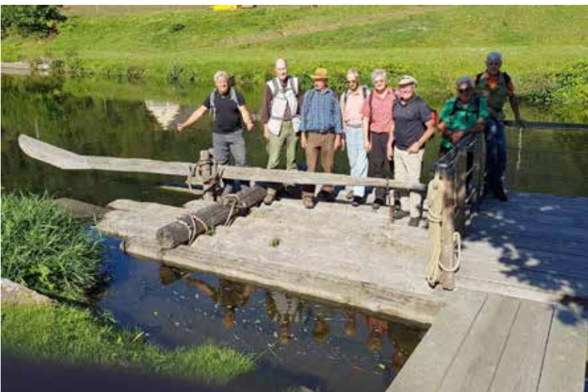
Station auf dem Kinzigtäler Flößerweg. Die Nachbildung eines Floßes lädt ein, sich auf die Kinzig zu begeben.