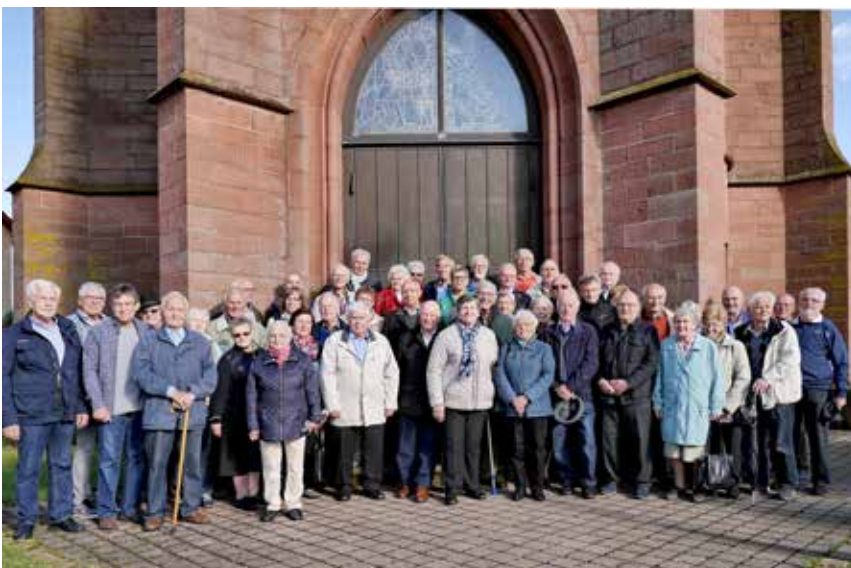
Gruppenfoto vor der Kirche St. Peter und Paul in Kilsheim-Steinbach.

Dass sich daraus die Gebetswache der Männer auf dem Lindenberg ergeben hat und bis zum heutigen Tag das Jahr hindurch von nahezu 1000 Männern getragen wird, kann nicht hoch genug gelobt und eingestuft werden. Wer zu Gott betet, darf ihn um alles bitten und zuversichtlich sein, dass seine Bitte erhört wird und der himmlische Vater sein Ohr nicht vor ihm verschließt.